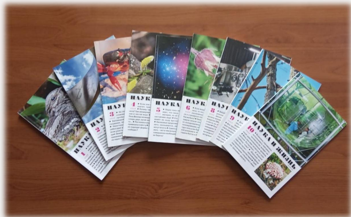
Журнал «Наука и жизнь», №№ 1–10, 2024 г.

В Национальной библиотеке Республики Адыгея хранятся годовые комплекты журнала «Наука и жизнь» с 1944 года по настоящее время.