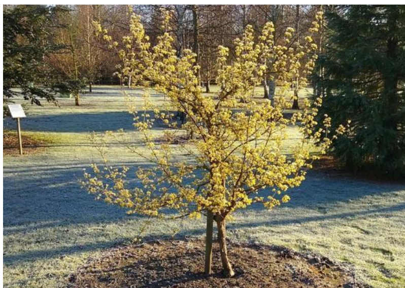
Рисунок 2 – Цветущее дерево кизила в городском парке.