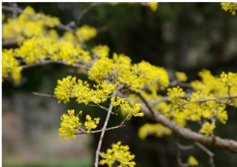
Рисунок 1 – Цветение кизила