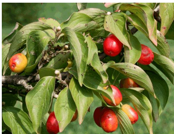
Рисунок 3 – Веточка кизила с плодами

Кизил мужской – вид с ранним цветением (февраль-март), хорошей облиственностью, яркими съедобными плодами украшающими растение до морозов (рис. 3). Растение хорошо переносит обрезку и стрижку, кустовые и штамбовые формы могут быть использованы для формирования шпалер (рис. 4), живой изгороди и посадки в вазоны. Кизил хорош и в культуре «бонсай» (рис. 5)