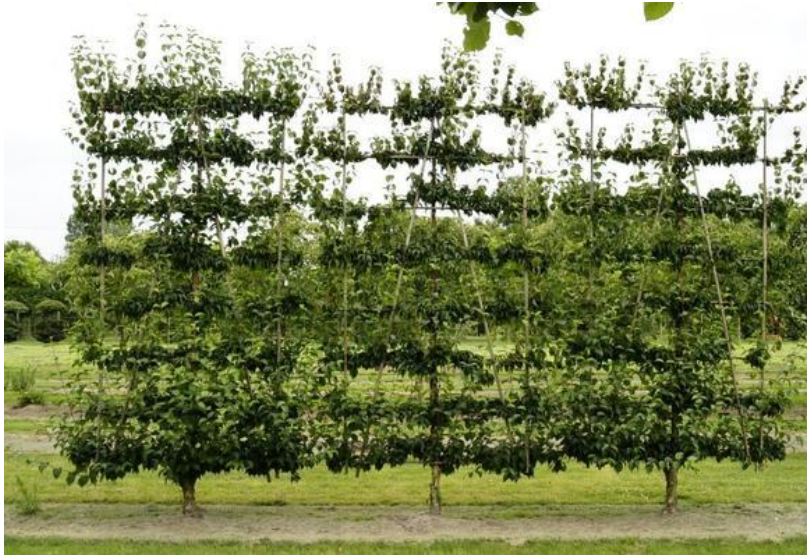
Рисунок 4 – Кизил на шпалере.