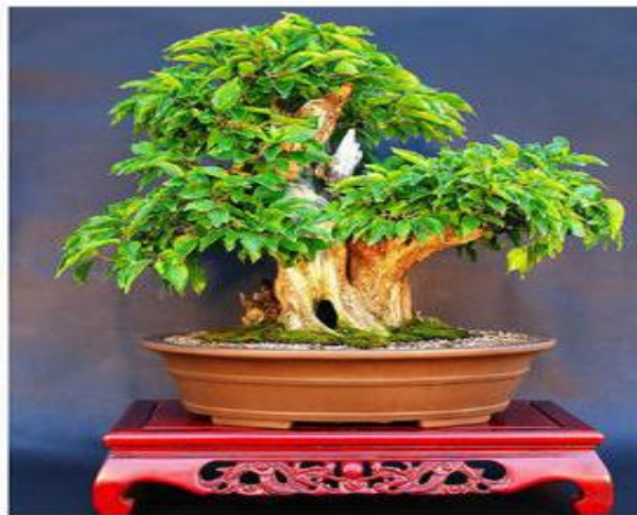
Рисунок 5 – Кизил в культуре бонсай

Кизил газо – дымоустойчив, нетребователен к почвенным условиям, что делает его перспективной породой в озеленении.