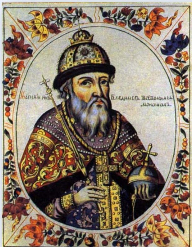
Великий князь Владимир II Всеволодович Мономах (1053–1125)

Предлагаем вниманию пользователей сайта краткий иллюстрированный рекомендательный список статей. Он включает в себя материалы о великих деятелях XI–XIX вв., внесших значительный вклад на важнейших этапах становления и развития отечественной государственности.