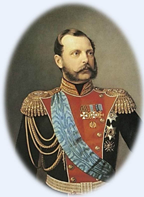
Александр II Николаевич Романов (1818–1881)

Основная заслуга: отмена крепостного права, реформы в области экономики, суда, армии.