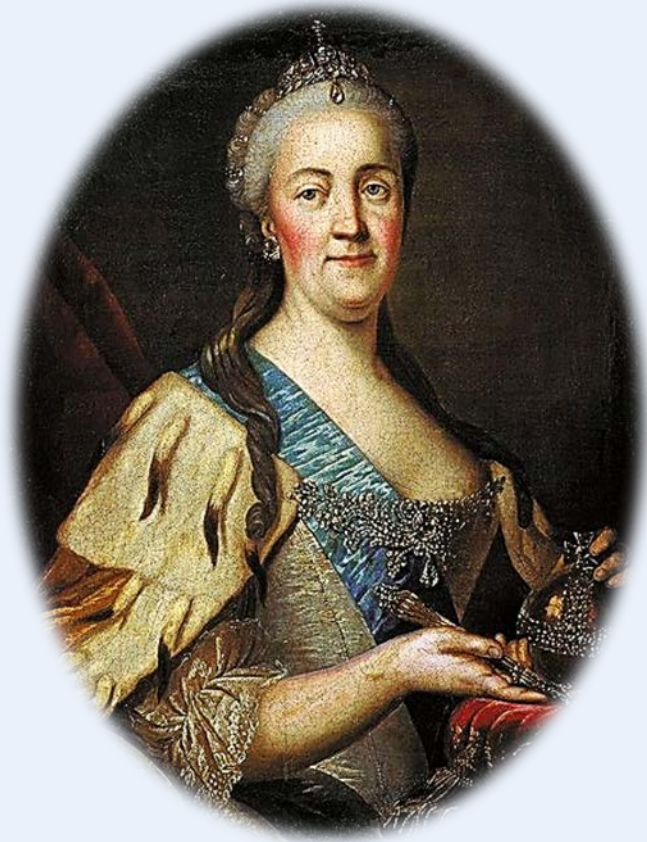
Екатерина II Алексеевна Романова (1729–1796)

Основная заслуга: существенное расширение границ России – присоединение Крыма, Причерноморья и восточной части Речи Посполитой.