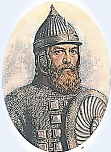
Князь Дмитрий Михайлович Пожарский (1578–1642)