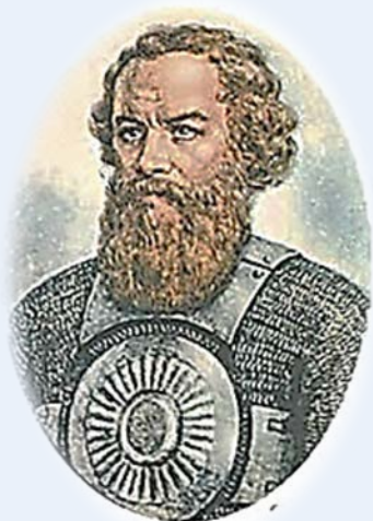
Гражданин Кузьма Минич Минин (155?–1616)