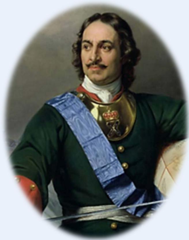
Петр I Алексеевич Романов (1672–1725)

«Трудом своим явил Россию он во цвете» // Знание-сила. – 2022. – № 6. – С. 4–48.