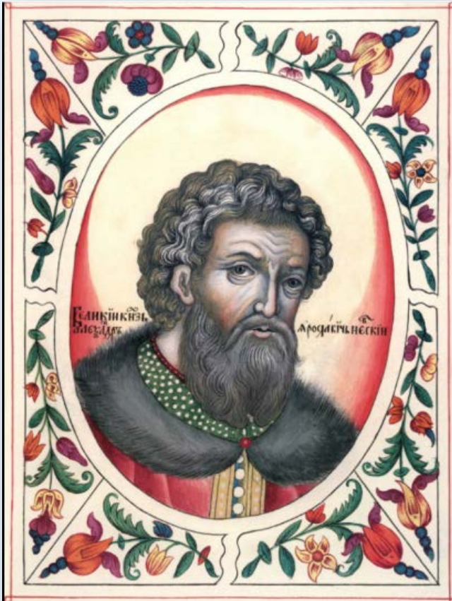
Князь Александр Ярославич Невский (ок. 1221–1263)

Александрина М. Кто с мечом к нам войдет, от меча и погибнет / Марина Александрина // Чудеса и приключения. – 2020. – № 5. – С. 94–96, 4-я обл.