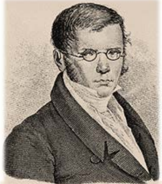
Петр Андреевич Вяземский