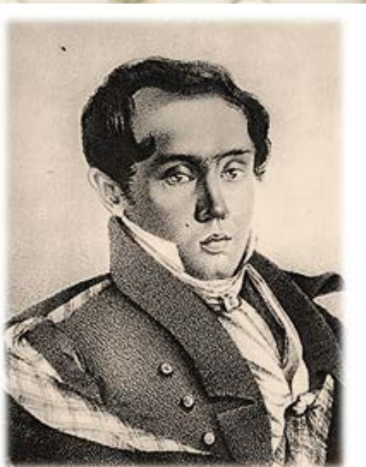
Евгений Абрамович Баратынский

Философ, критик и публицист Иван Васильевич Киреевский прекрасно знал Пушкина и круг его друзей. Он писал: «Общее мнение скоро соединило имя Баратынского с именами Пушкина и Дельвига, в то же время как внутреннее сродство сердечных пристрастий связало их самую искреннюю дружбою, цело сохранившеюся до конца жизни всех трех» .