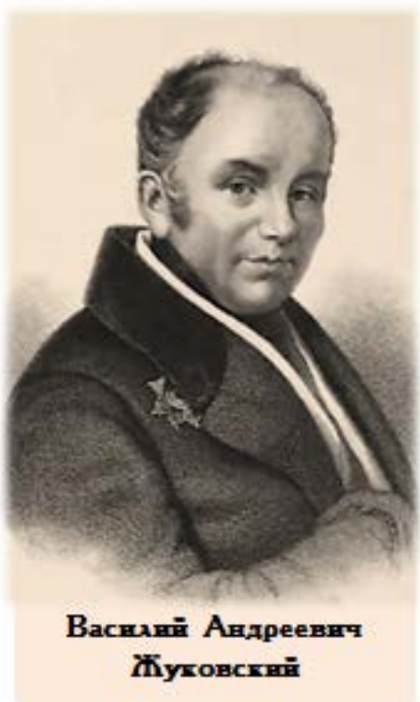
Василий Андреевич Жуковский