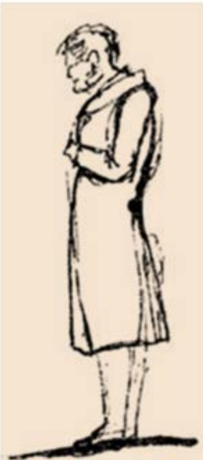
Князь Вяземский на рисунке Пушкина