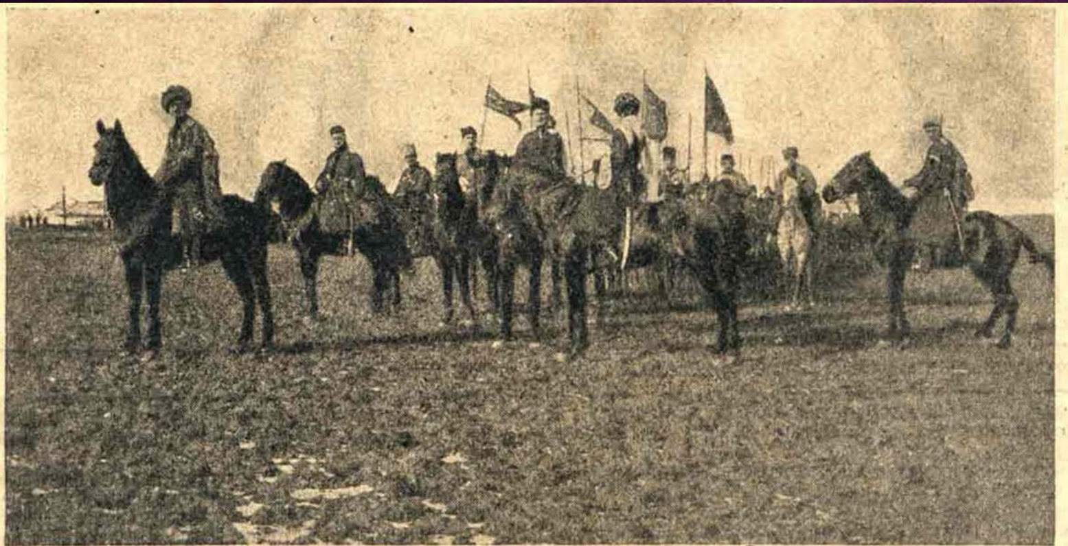
На юго-западномъ фронтѣ. Кавказцы туземной дивизіи, отличившіеся во время послѣдняго наступленія.