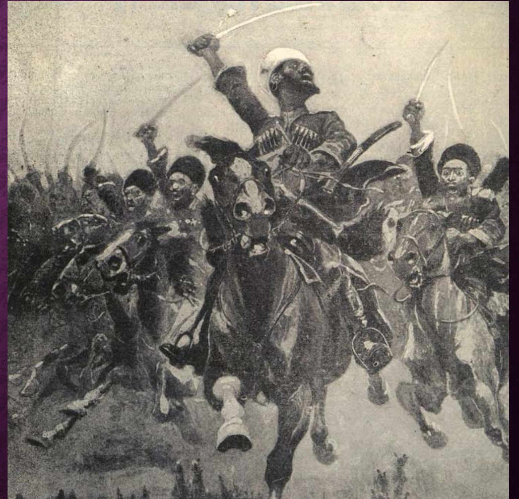
Атака. (Автор неизвестен)

ОДНО УПОМИНАНИЕ О НИХ НАВОДИЛО УЖАС НА ВРАГОВ ПО ВСЕМУ ВОСТОЧНОМУ ФРОНТУ . НЕМЦЫ И АВСТРИЙЦЫ НАДОЛГО ЗАПОМНИЛИ ОБРАЗ ЛИХОГО КАВКАЗСКОГО ВСАДНИКА, НЕ ЗНАЮЩЕГО ПОЩАДЫ.