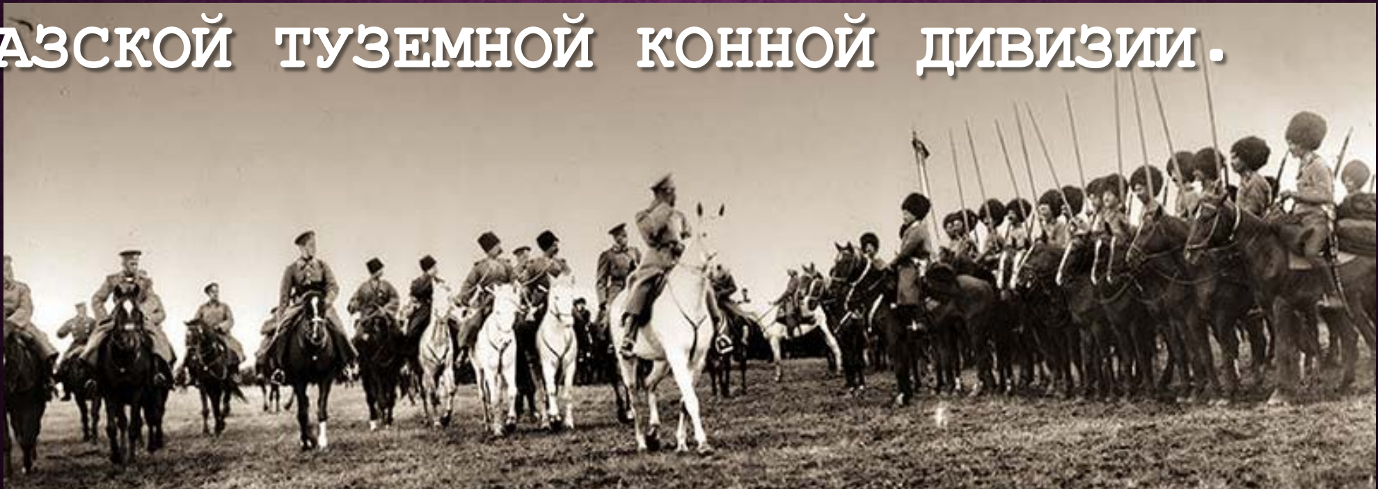
Николай II и всадники Кавказской туземной конной дивизии

1 АВГУСТА 1914 ГОДА НАЧАЛАСЬ ПЕРВАЯ МИРОВАЯ ВОЙНА. 23 АВГУСТА 1914 ГОДА НИКОЛАЙ II ПОДПИСАЛ УКАЗ О ФОРМИРОВАНИИ ИЗ ГОРЦЕВ КАВКАЗА КАВКАЗСКОЙ ТУЗЕМНОЙ КОННОЙ ДИВИЗИИ.