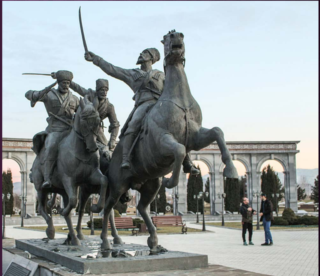
Памятник ингушскому полку Туземной конной дивизии в Назрани

ВСАДНИКИ «ДИКОЙ ДИВИЗИИ» ВСТРЕЧАЛИСЬ НА ПОЛЕ БОЯ С НАИБОЛЕЕ БОЕСПОСОБНЫМИ ВОИНСКИМИ ФОРМИРОВАНИЯМИ ПРОТИВНИКА – ВЕНГЕРСКОЙ КАВАЛЕРИЕЙ, ТИРОЛЬСКИМИ СТРЕЛКАМИ И ГЕРМАНСКОЙ ПЕХОТОЙ.