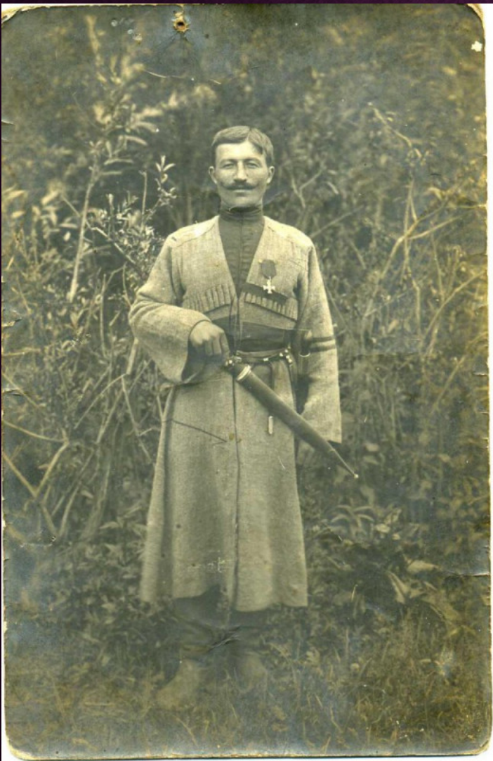
Унтер-офицер Черкесского полка «Дикой дивизии»

ЧЕРКЕССКИЙ КОННЫЙ ПОЛК ДИВИЗИИ БЫЛ СФОРМИРОВАН ИЗ ДОБРОВОЛЬЦЕВ – ЖИТЕЛЕЙ ЕКАТЕРИНОДАРСКОГО, МАЙКОПСКОГО И БАТАЛПАШИН- СКОГО ОТДЕЛОВ КУБАНСКОЙ ОБЛАСТИ. ВСАДНИКОВ, ДОСТОЙНЫХ ВСТАТЬ В РЯДЫ ПОЛКА, КАЖДОЕ СЕЛО И АУЛ ВЫБИРАЛИ НА СХОДАХ НА КОНКУРСНОЙ ОСНОВЕ ИЗ ЧИСЛА СВОИХ ЖИТЕЛЕЙ.