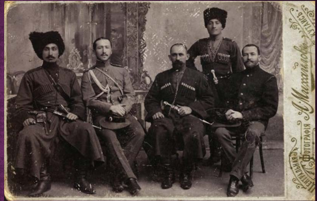
Офицеры Черкесского полка в Тифлисе

СУЛТАН КРЫМ-ГИРЕЙ СДЕЛАЛ СВОЙ ВЫБОР В ПОЛЬЗУ ФЕВРАЛЬСКОЙ РЕВОЛЮЦИИ, НЕ ПОДДЕРЖАЛ КОРНИЛОВСКИЙ МЯТЕЖ И ДОБИЛСЯ ВОЗВРАЩЕНИЯ ПОЛКА НА КАВКАЗ.