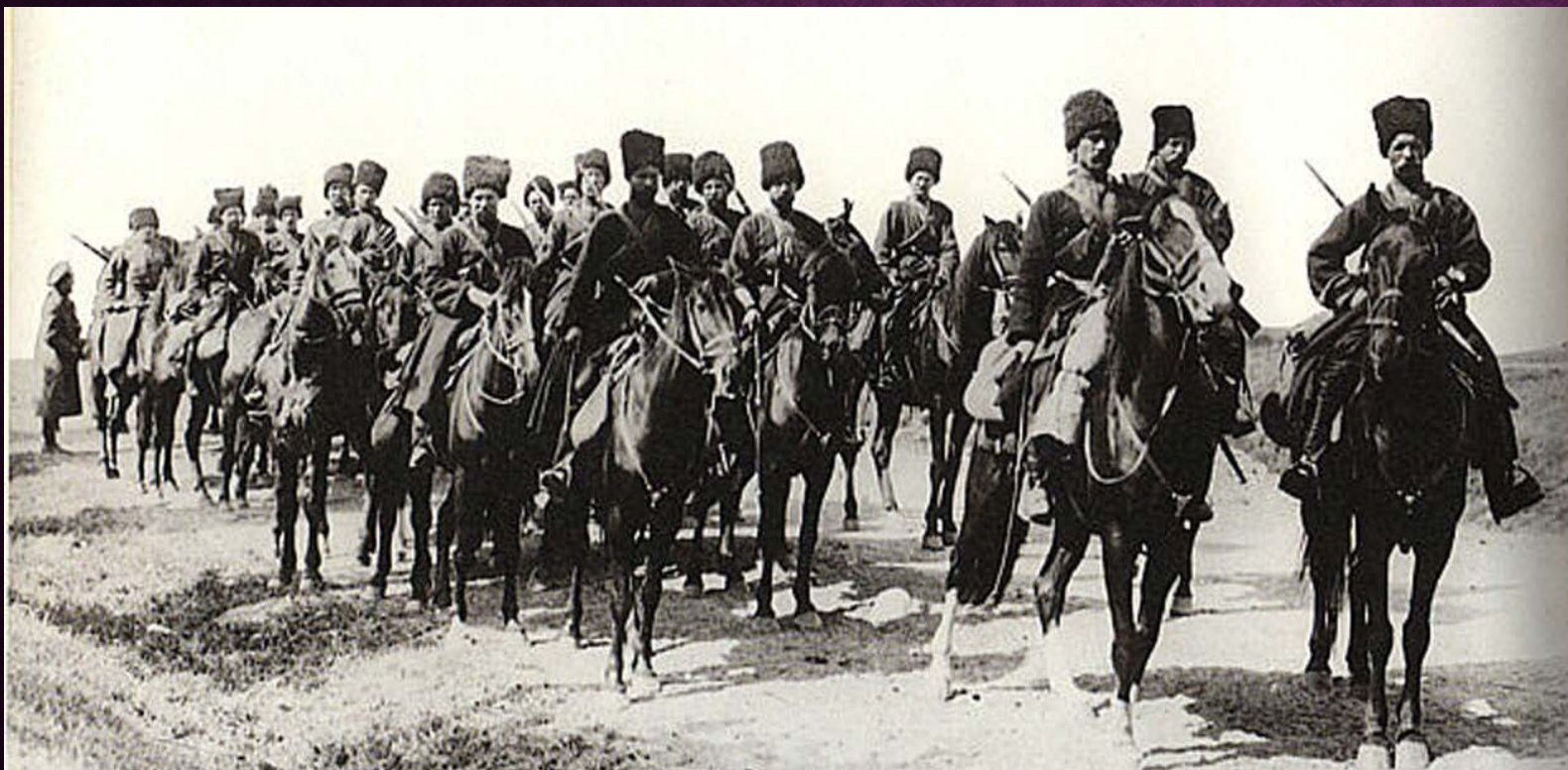
Конный полк в походе

ДЖИГИТЫ НЕ НУЖДАЛИСЬ В КАЗЕННЫХ КОНЯХ. ОНИ ПРИХОДИЛИ СО СВОИМИ. НЕ НАДО БЫЛО ОБМУНДИРОВАНИЯ – ОНИ БЫЛИ ОДЕТЫ В СВОИ ЧЕРКЕСКИ. ОСТАВАЛОСЬ ТОЛЬКО НАШИТЬ ПОГОНЫ.