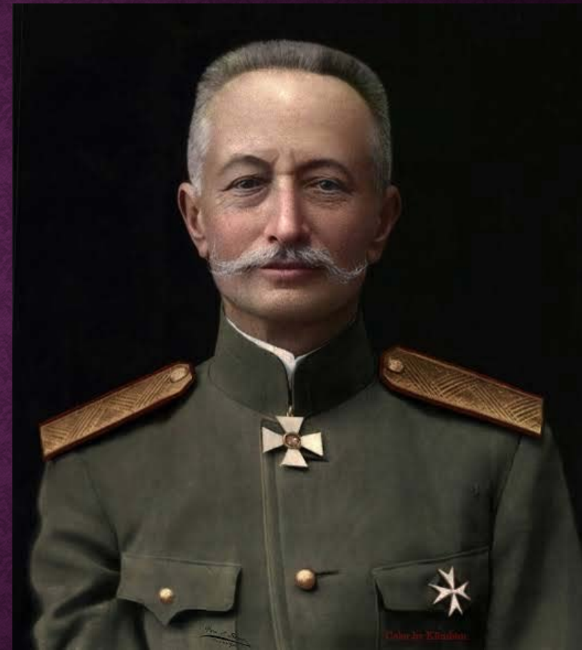
Алексей Алексеевич Брусилов (1853 – 1926)