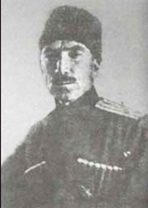
Султан Крым Гирей Селетович

ВАЖНУЮ РОЛЬ В ИСТОРИИ ЧЕРКЕССКОГО ПОЛКА СЫГРАЛ ЕГО КОМАНДИР ПОЛКОВНИК СУЛТАН КРЫМ-ГИРЕЙ.