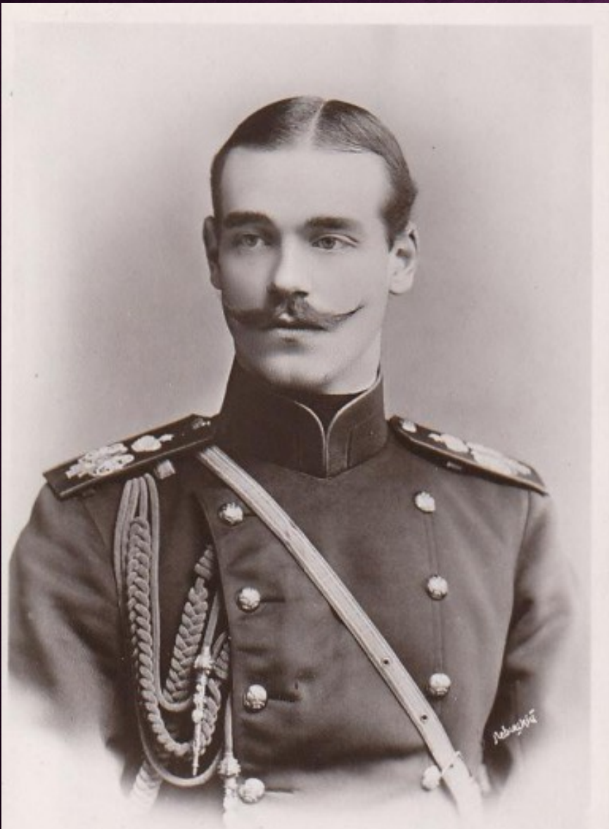
Великий князь Михаил Александрович

НАЗНАЧЕНИЕ БРАТА ИМПЕРАТОРА ИХ КОМАНДИРОМ ЛЬСТИЛО САМОЛЮБИЮ КАВКАЗСКИХ ДОБРОВОЛЬЦЕВ, И ОНИ СТРЕМИЛИСЬ ОТЛИЧИТЬСЯ В ЕГО ГЛАЗАХ.