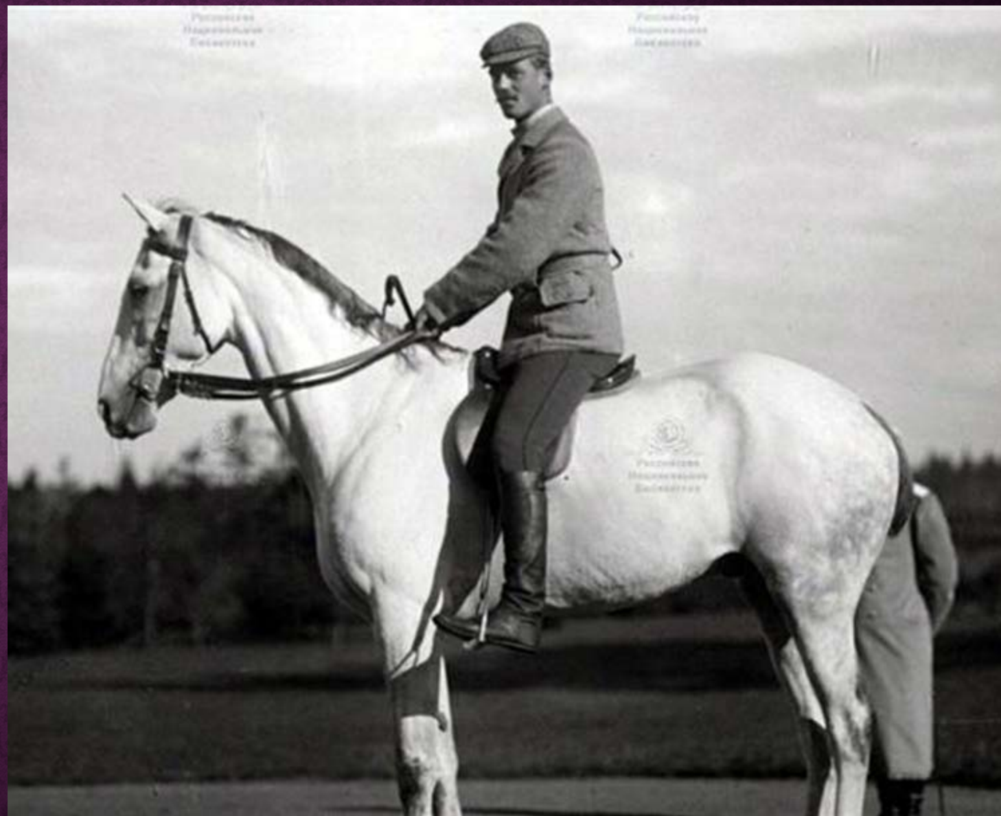
Великий князь Михаил Александрович

ВЕЛИКИЙ КНЯЗЬ ВПОЛНЕ СООТВЕТСТВОВАЛ НОВОЙ ДОЛЖНОСТИ, БУДУЧИ ЛИХИМ НАЕЗДНИКОМ, НЕ ОТСТАВАВШИМ В ИСКУССТВЕ ВЕРХОВОЙ ЕЗДЫ ОТ СВОИХ ПОДЧИНЁННЫХ .