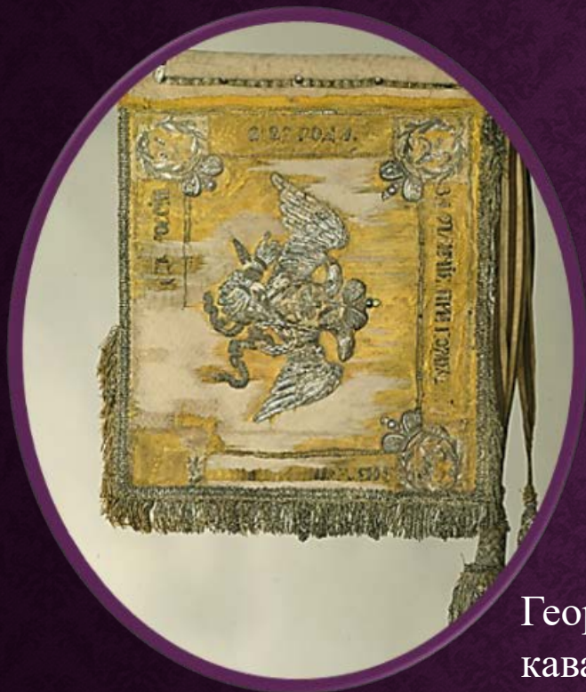
Георгиевский штандарт кавалерийского полка

Атака черкесского полка при захвате города в австрийской Галиции (французская открытка)