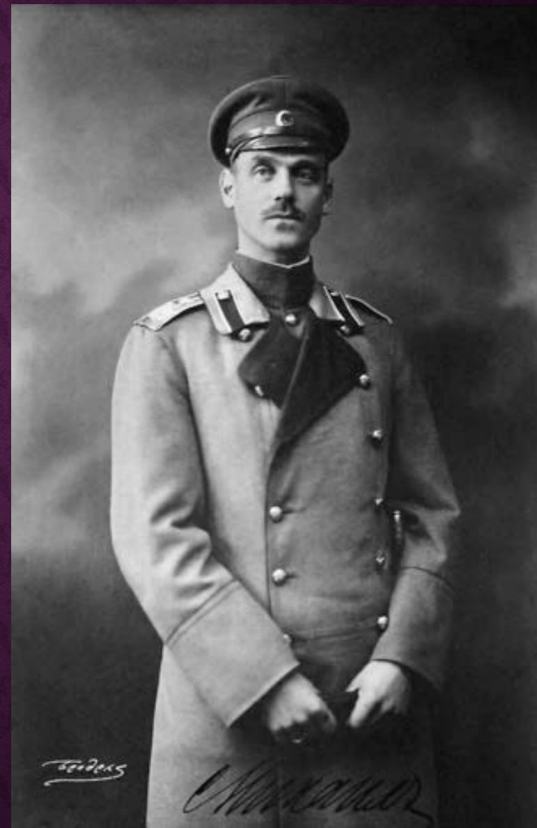
Великий князь Михаил Александрович

ЭТИМ НАЗНАЧЕНИЕМ ЦАРЬ ОБОЗНАЧИЛ ВЫСОКИЙ СТАТУС ДИВИЗИИ И ПРОДЕМОНСТРИРОВАЛ СВОЕ УВАЖЕНИЕ К ГОРЦАМ, ЗАЩИЩАВШИМ СТРАНУ.