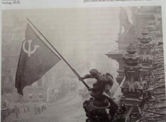
Знамя Победы над Рейхстагом. 2 мая 1945 года. Краткое фото Евгения Халды. «Наука и жизнь» № 5, 2020.

Война далекая и прошлая укладывает события Великой Отечественной войны. Поэтому на каждой странице, открывающейся в памяти, и в каждой строке, следуют тучи воспоминаний. Они приходят в голову, когда вспоминаешь Берлин, и они приходят на стене Рейхстага зафиксированными. Поэтому попытайтесь вспомнить и рассказать о событиях тех дней по личным впечатлениям и по рассказам других участников боя, о том, как те страшные события разворачивались на самом деле. Это как бы описанием фотопленки, зафиксированной в момент участия в той героической и страшной битве. Начнем с того, что русские дважды штурмовали Берлин. Первый раз это было в начале календарной Советской войны (1940–1941 и 1940 году. В той войне из-за «Ахтервагского инцидента» столкнулись два блока европейских государств. По одну сторону стояли воюющие Прусские королевства и Англия. По другую — Франция, Франция и Россия, которые оказались втянутыми в эту войну в результате самозащиты. Спешившая к Советскому Союзу армия участвовала в той войне. В исторической литературе той войны и штурму Берлина было уделено много внимания. Спешившая к Советскому Союзу армия участвовала в той войне. В исторической литературе той войны и штурму Берлина было уделено много внимания. Спешившая к Советскому Союзу армия участвовала в той войне. В исторической литературе той войны и штурму Берлина было уделено много внимания.