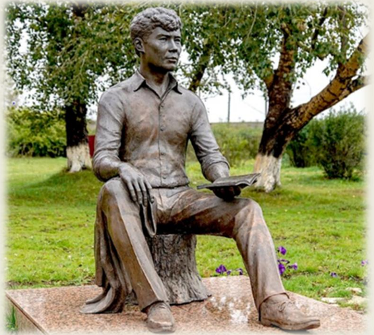
Памятник А. Вампилову на родине в Кутулике Иркутской области