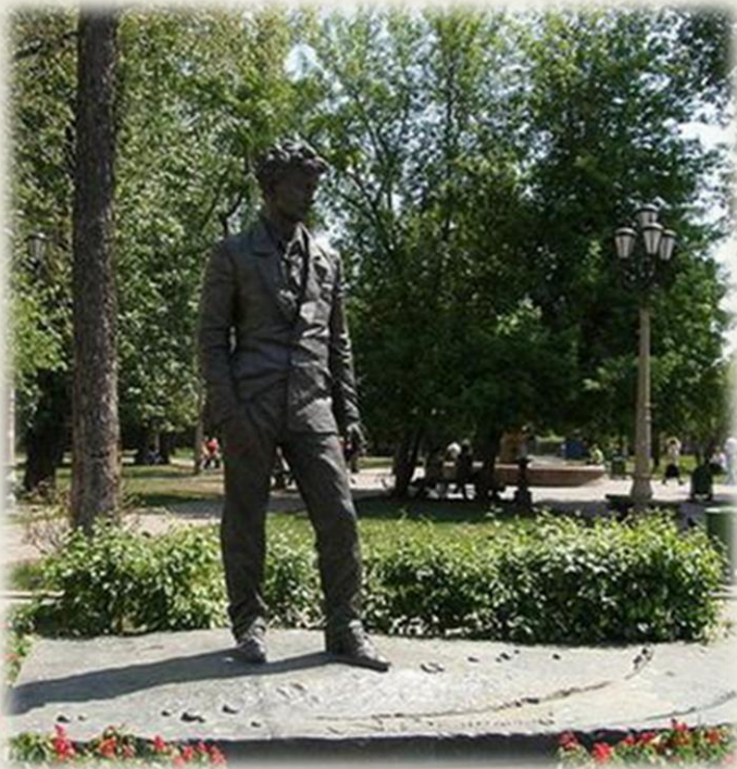
Памятник А. Вампилову в Иркутске