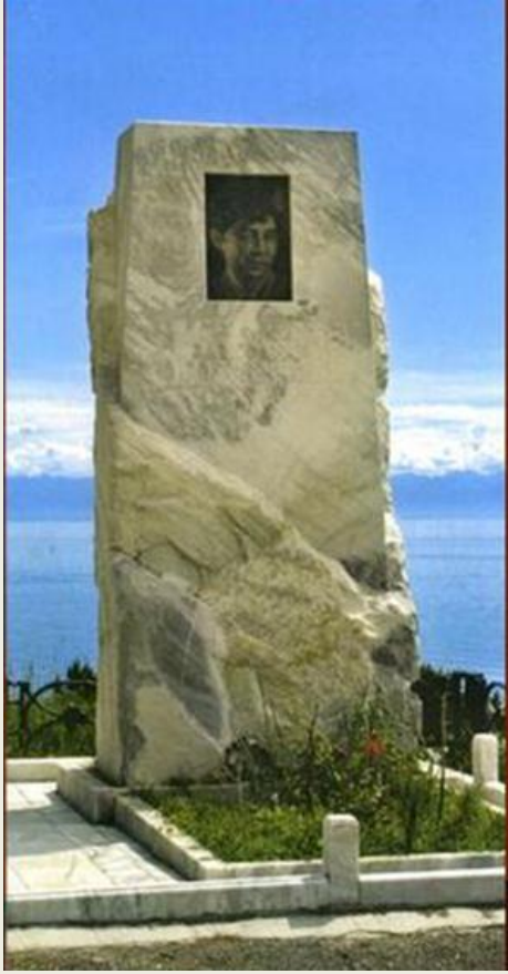
Мемориальный камень на месте гибели А. Вампилова.