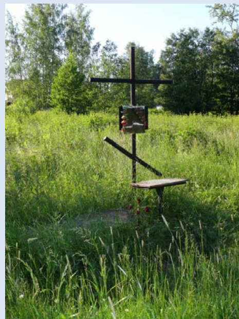
Крест-кенотаф в вероятном месте расстрела Гумилева (Бернгардовка, долина реки Лубьи)

Свою жизнь Гумилев построил как приближение к идеалу поэта: многие годы он посвятил ученичеству и строгой дисциплине, постепенно расширял и в то же время конкретизировал мир своих образов.