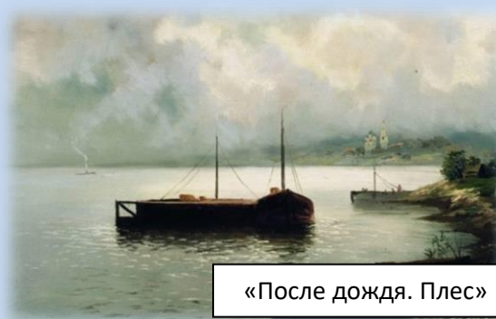
«После дождя. Плес»