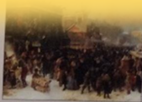
К. Е. Маковский. Народное гулянье во время Масленицы на Адмиралтейской площади в Петербурге, 1869

В статье описывается масленичная неделя, которая делится на два периода: «Узкую Масленицу» (первые три дня) и «Широкую Масленицу» (последние четыре дня недели).