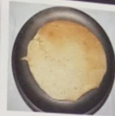
ПЕРВЫЙ СЛИЗЬ ЗА И ТОТ КОЛОД