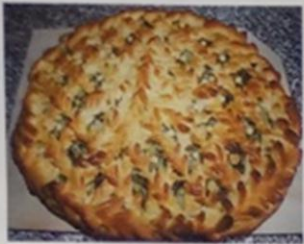
ГДЕ ПИРОГ С КРУПОЙ, ТАМ И МЯСО С РУКОЙ*