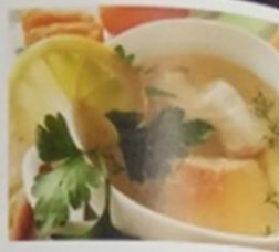
ГДЕ КАЛЯ, ТАМ И Я