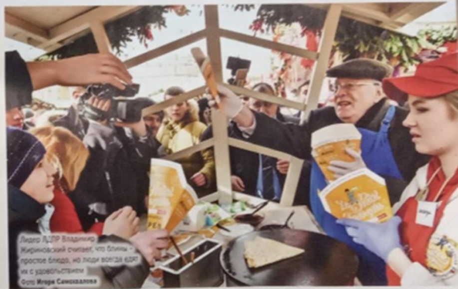
Лидер ЛДПР Владимир Жириновский считает, что блины – простое блюдо, но люди всегда едят их с удовольствием

...блины, сметана, мед, рыба, икра – практически что угодно можно положить внутрь, и будет вкусно.