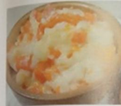
ПШЕННАЯ КАША С ТЫКВОЙ