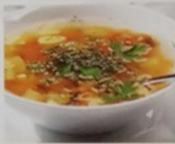
ГДЕ ЩИ, ТУТ И НАС ИЩИ