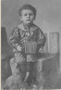
г. Екатеринодар. 1899 г.