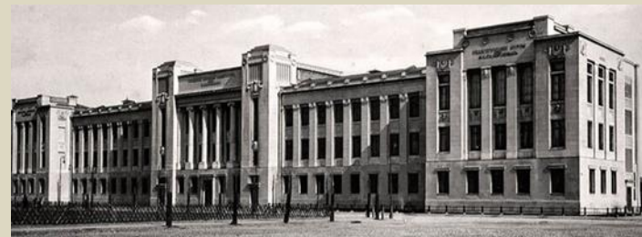
Московский городской народный университет им. А. Л. Шанявского.