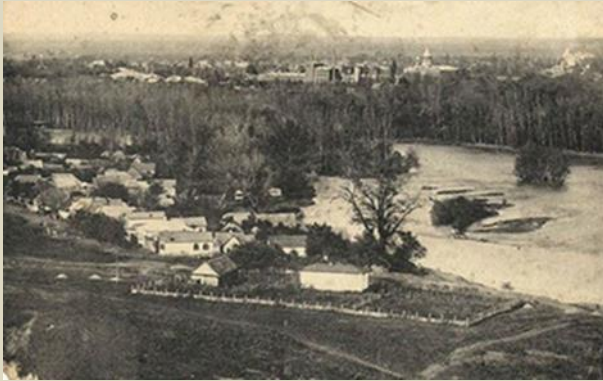
Майкоп. 1914 г.