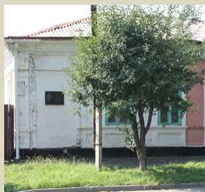
Дом Капустина (ул. Победы, 19)