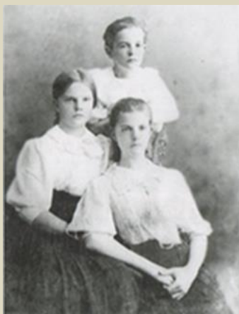
Сестры Соловьевы. Середина 1900-х гг.