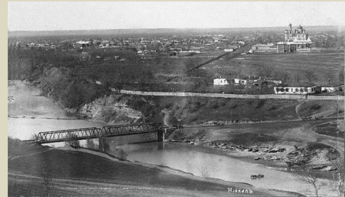
Майкоп. Начало XX века.

... город летом стоял в зелени, казался чистеньким из-за выбеленных стен, но ранней весной, осенью, да и теплой зимой тонул в черноземной грязи. На тротуарах росла трава.