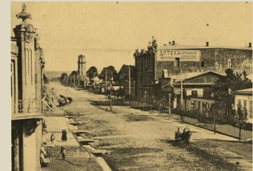
Аптека Альтшулера на улице Соборной (ул. Первомайская, 197)

Кроме аптеки Горста, в Майкопе была еще аптека Альтшулера в самом центре города, на Брехаловке. Она походила на столичную аптеку, как рассказывали студенты наши, побывавшие в Москве и Петербурге.