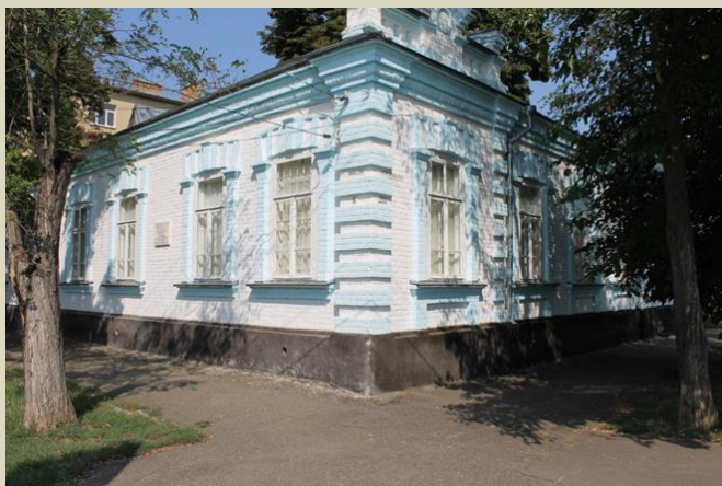
Дом Соловьевых. 2021 г.