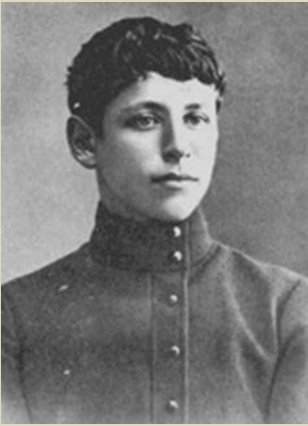
Женя Шварц. 1911 г.