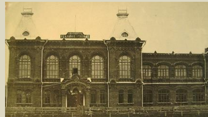
Майкопское реальное училище (ул. Пушкина, 173)

Вот так и шли дни за днями, полные горестей и радостей, и приблизилась весна 1905 года. Я пошел держать экзамен в реальное училище. Оно, училище, готовилось уже к переезду в новое красивое двухэтажное здание... Старое реальное училище помещалось в белом просторном одноэтажном доме во дворе. ... Нас посадили за парты и дали задачи: сидящим направо – одни, сидящим налево – другие. ... задачу я не доделал. ... мне сказали, я «зачислен кандидатом». ... еще осенние испытания. После них состоится заседание педагогического совета и всех нас примут в подготовительный класс ... Я надел я впервые в жизни длинные темно-серые брюки и того же цвета форменную рубашку, и мне купили фуражку с гербом и сшили форменное пальто. ... Но вот список принятых повесили возле канцелярии училища, и мы с мамой отправились в магазин Мареева покупать учебники. ... мне купили и учебники, и тетради, и деревянный пенал, ... и, чтобы носить все это в училище, – ранец.