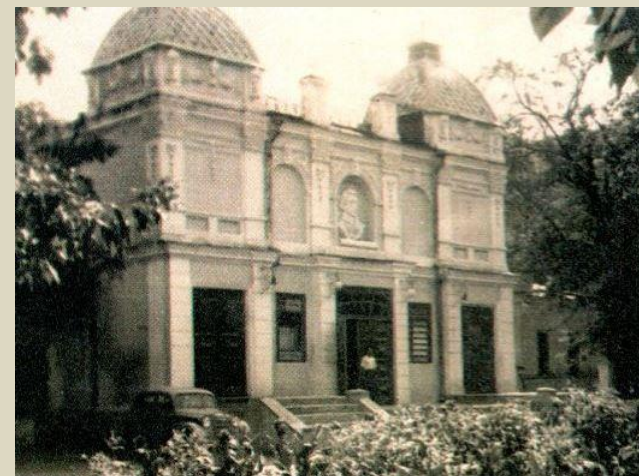
Пушкинский народный дом

... началась новая зима 903/904 года. Осенью исполнилось мне семь лет. ... Я стал гораздо самостоятельнее. Я один ходил в библиотеку – вот тут и началась моя долгая, до сих пор не умершая любовь к правому крылу Пушкинского дома. ... Левее стола библиотekarши, у прохода в читальню, стоял другой стол, с журналами. Но в те годы читальный зал я не посещал. Я передавал библиотekarше прочитанную книгу и красную абонементную книжку, она отмечала день, в который я книгу возвращаю, и часто выговаривала мне за то, что читаю слишком быстро. Затем я сообщал ей, какую книжку хочу взять, или она уходила вглубь библиотеки, начинала искать подходящую для меня книгу.