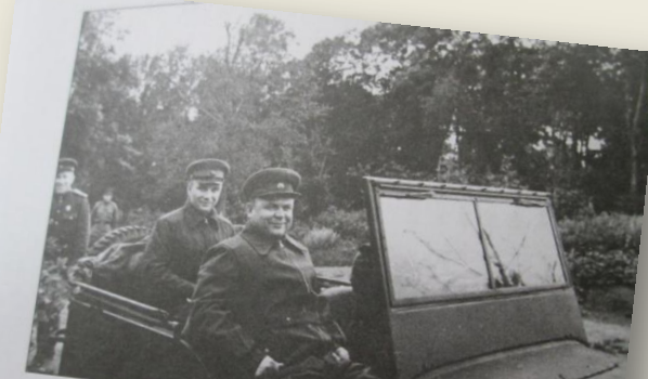
Командующий Воронежским фронтом генерал армии Н.Ф. Ватулин перед выездом в войска Июль 1943 г.

приказ машин п учётот з ТА на «т 235 танк Но арм мотопез