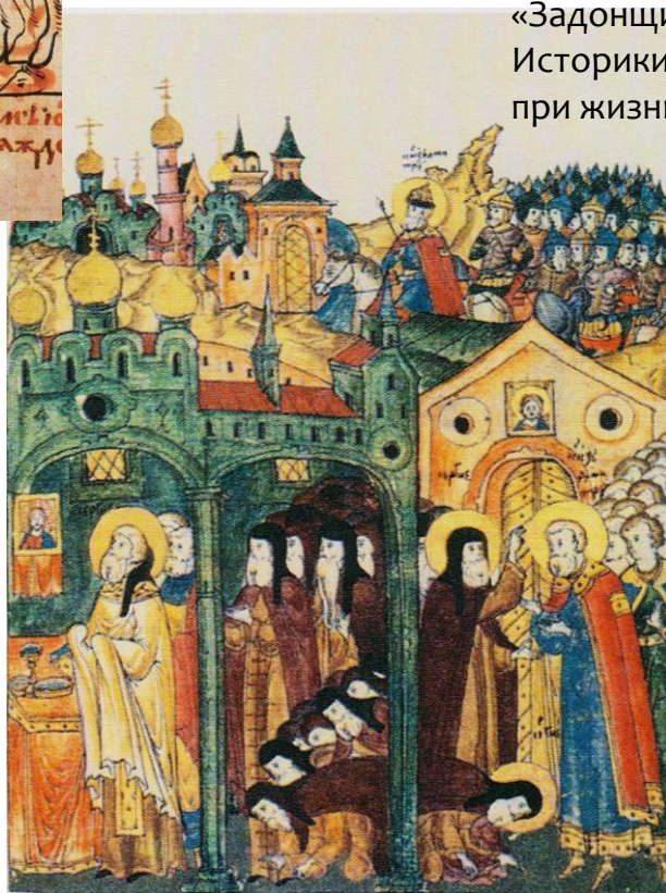
Преподобный Сергий Радонежский встречает великого князя Дмитрия Донского после победы над Мамаем и служит заупокойную литургию по всем убиенным на Куликовом поле.