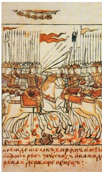
Куликовская битва. Миниатюра из «Сказания о Мамаевом побоище». XVII в.