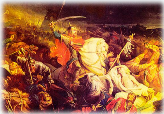
Куликовская битва. Художник А. Ивон. 1850 г

В фонде Национальной библиотеки Республики Адыгея имеется значительное количество литературы о Куликовской битве и о князе Дмитрии Донском. Это художественные произведения, документально-исторические исследования, энциклопедические материалы и статьи из периодических изданий.