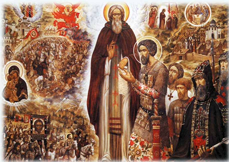
Святой Сергий Радонежский благословляет святого князя Дмитрия Донского. Художник С. Б. Симаков. 1988 г.

Куликовская битва (Мамаево или Донское побоище) – крупное средневековое сражение между объединенным русским войском во главе с Великим князем Владимирским и князем московским Дмитрием Ивановичем и войском правителя западной части Золотой Орды Мамаю. Битва состоялась 8 сентября 1380 года на Куликовом поле к югу от впадения реки Непрядва в Дон (юго-восток Тульской области).