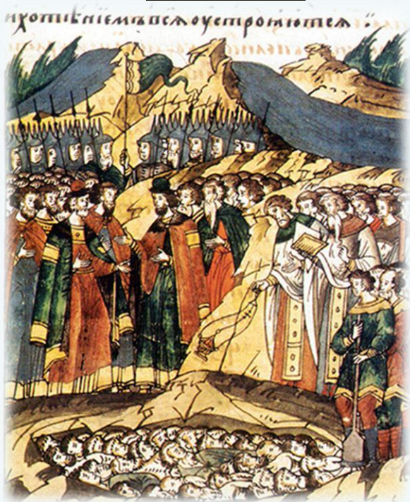
Ополчение великого князя Дмитрия Ивановича в 1380 г. Лубок XVII в.

Важным следствием этого сражения стало усиление авторитета Москвы и ее роли в образовании единого Русского государства.