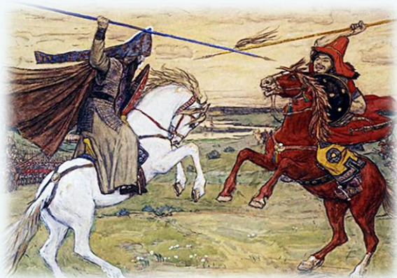
Поединок Пересвета с Челубеем. Художник В. М. Васнецов. 1914 г

Рудаков В. Н. Дмитрий Донской, Тохтамыш и другие / В. Н. Рудаков. – Текст : непосредственный // Преподавание истории в школе. – 2022. – № 8. – С. 19–24 : ил. – ISSN 0132-0696.