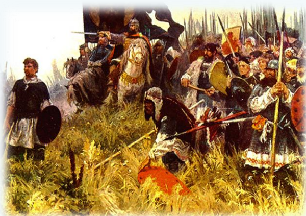
Утро на поле Куликовом. Художник А. П. Бубнов. 1943–1947.