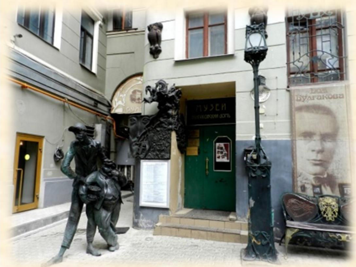
Музей Михаила Булгакова. Москва, улица Большая Садовая, дом 10, подъезд 6.

В 2016 году литературоведы продолжают обращаться к творчеству М. А. Булгакова. Опубликован ряд новых статей об этом писателе. С ними можно познакомиться в секторе текущих периодических изданий Национальной библиотеки республики Адыгея.