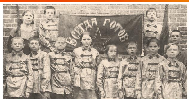
Один из первых пионерских отрядов