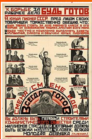
Плакат «К борьбе за рабочее дело будь готов! Всегда готов! Смена смене идет». 1925 год

Идея необходимости создания коммунистической организации для работы с детьми была сформулирована Н. К. Крупской , которая в ноябре 1921 года несколько раз выступала с докладом «О бойскаутизме». Доклад был вскоре опубликован в виде брошюры под заглавием «РКСМ и бойскаутизм». Крупская предложила комсомолу взять на вооружение скаутские методы и создать детскую организацию «скаутскую по форме и коммунистическую по содержанию».