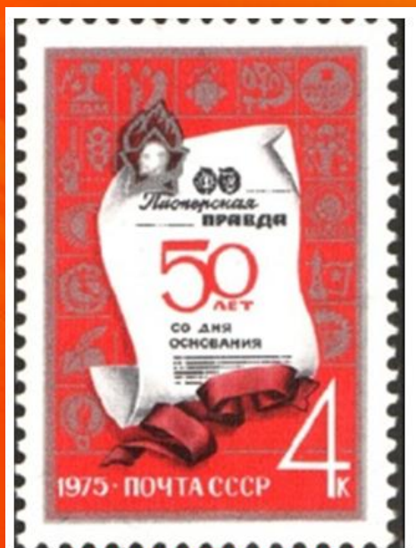
Почтовая марка СССР, посвященная 50-летию газеты «Пионерская правда». 1975 год.

В 1950–1970-е годы пионерское движение было направлено на воспитание патриота, порядочного гражданина, ведущего здоровый образ жизни. В это время среди пионеров были популярны туристские походы, смотры, всесоюзные игры, спортивные соревнования.