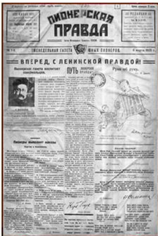
«Пионерская правда» № 1–4 1925 года.

В пионерскую организацию принимали школьников в возрасте от 9 до 14 лет. Прием производили индивидуально, открытым голосованием на собрании пионерского отряда или дружины. Вступающий в пионерскую организацию на пионерской линейке давал «Торжественное обещание пионера Советского Союза». Коммунист, комсомолец или старший пионер повязывал ему красный пионерский галстук и прикалывал (вручал) пионерский значок. Как правило, в пионеры принимали в торжественной обстановке во время коммунистических праздников в памятных историко-революционных местах, например, 22 апреля возле памятника В. И. Ленину.