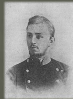
Л. СОБИНОВ В СТУДЕНЧЕСКИЕ ГОДЫ