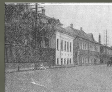
Дом Собиновых в Ярославле