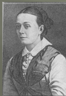
Родители Л. В. Собинова

Автор составил всесторонний портрет певца не только на основе общеизвестных фактов, но и воспоминаний ближайшего окружения самого Собинова.