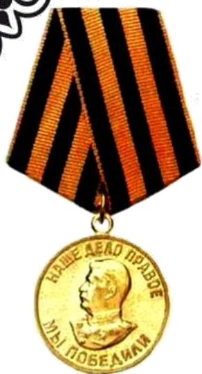
Медаль «За победу над Германией в Великой Отечественной войне 1941—1945гг»