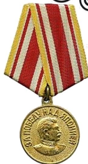
Медаль «За победу над Японией»

«Более чем прекращения нынешней [Второй мировой] войны, мы хотим прекращения развязывания всех войн».