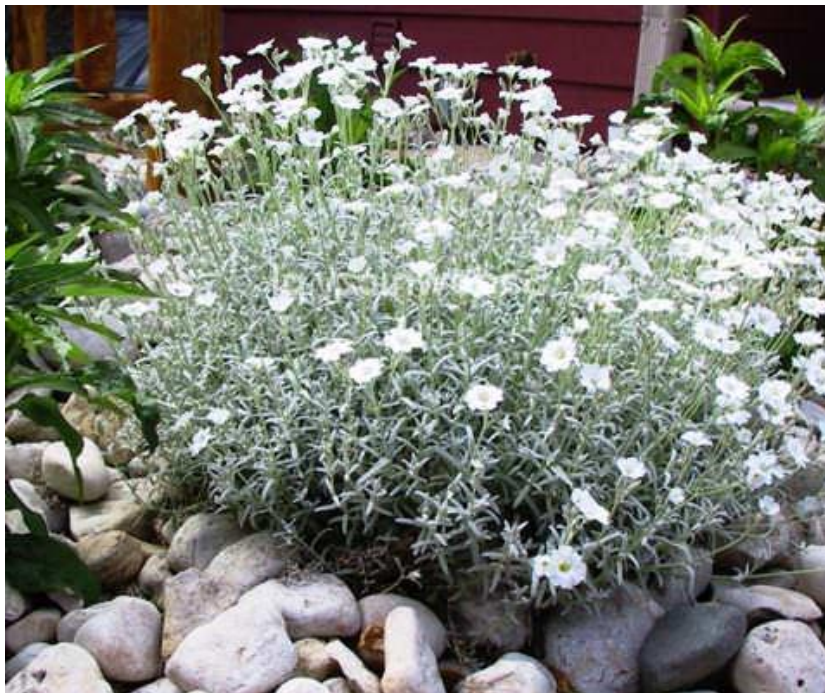
Рисунок 7 – Ясколка

За исключением водно-болотных почв культура будет расти практически в любом грунте. Однако растение предпочитает легкие, песчаные или суглинистые, проницаемые и не слишком плодородные почвы, которые легко прогреваются.