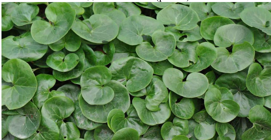
Рисунок 5 – Копытень европейский

Копытень европейский ( Asarum europaeum ) – стелющееся растение с ветвящимся корневищем, ежегодный прирост которого составляет порядка 4-6 см. Листья культуры темно-зеленые с сизоватым оттенком, кожистые на длинных черешках, зимуют, так что она сохраняет декоративность на протяжении всего года. Пластинка листа напоминает лошадиное копыто (рис. 5).