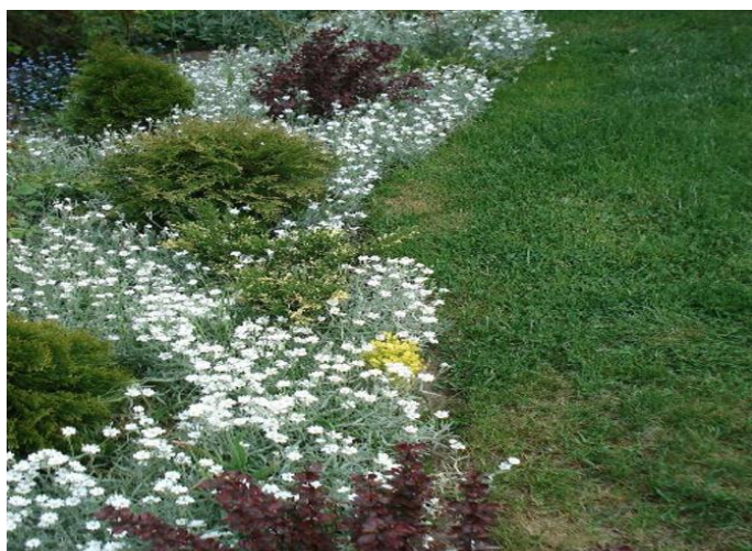
Рисунок 8 – Ясколка в саду, миксбордере, на клумбе и альпийской горке

Создает роскошные каскады на склонах и уступах, заполняет промежутки между плитами садовых дорожек, в щелях между камнями. Хорошо сочетается с другими культурами, создавая эффектный фон для невысоких хвойных, декоративных трав, барбариса Тунберга, бересклета, японской спиреи.