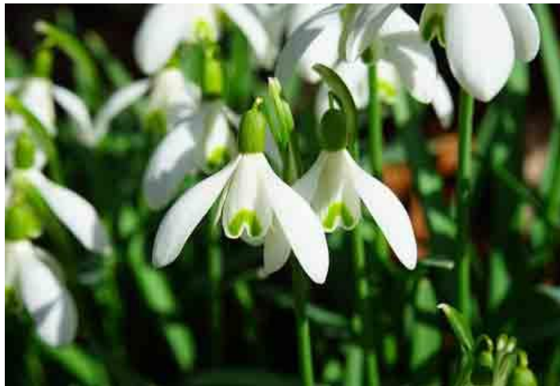
Рисунок 1- Подснежник кавказский