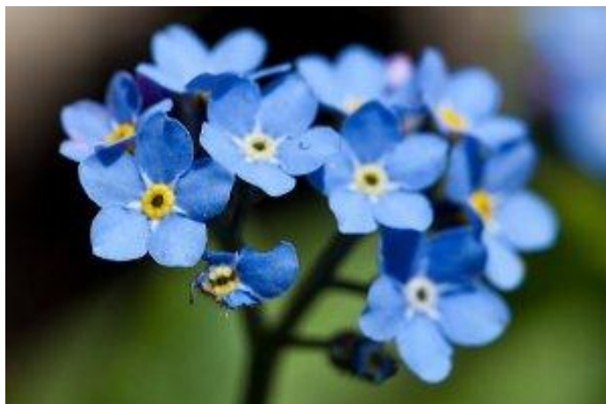
Рисунок 3. - Лесная незабудка

дней. Если сажать её на хорошо освященных участках время цветения сократится до 20 дней.