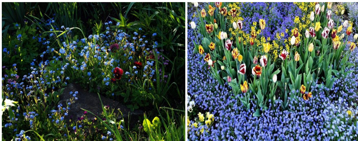
Рисунок 4 – Незабудка в саду, на клумбе и в декоративном контейнере

Эти цветники не требуют большого вложения труда, так как и ландыш и незабудка образуют плотный напочвенный покров, препятствующий росту сорняков.