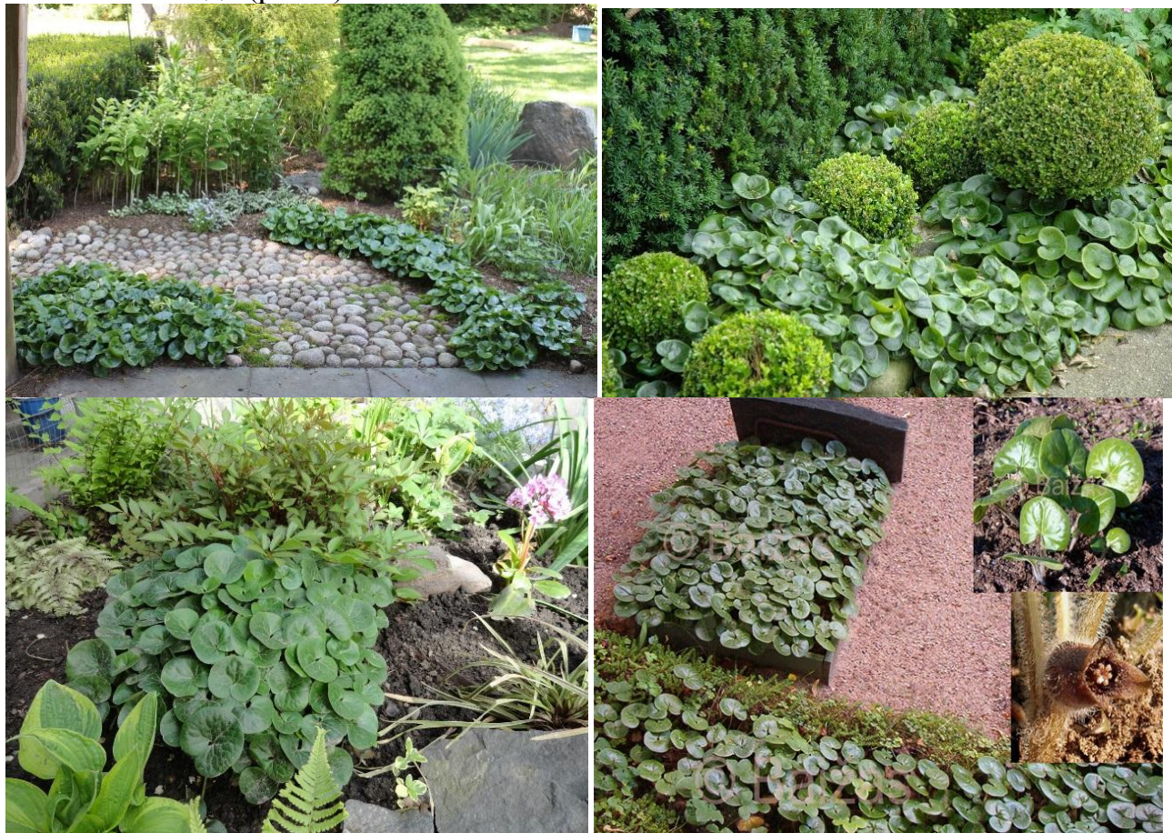
Рисунок 6 – Копытень в ландшафтном дизайне

Копытень относится к почвопокровным растениям. Благодаря небольшой высоте и неприхотливости этот многолетник нередко используется в ландшафтном дизайне теневого сада (рис.6)