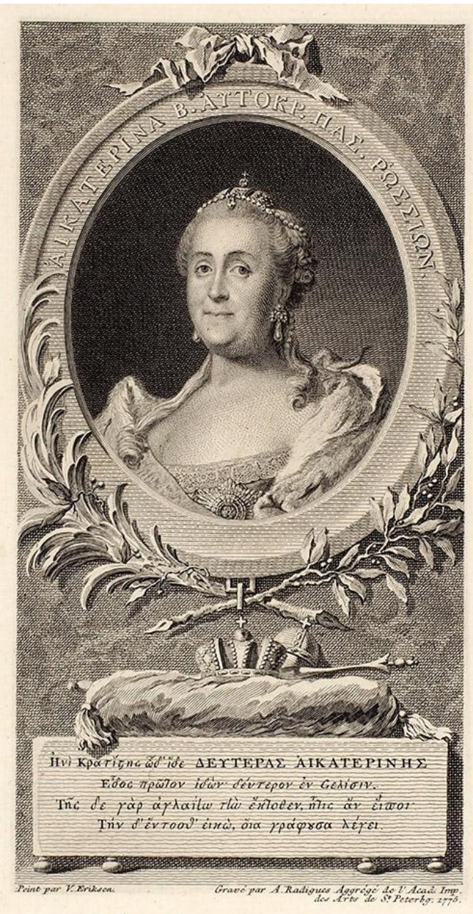
Портрет ЕКАТЕРИНЫ АЛЕКСЕЕВНЫ (1775).