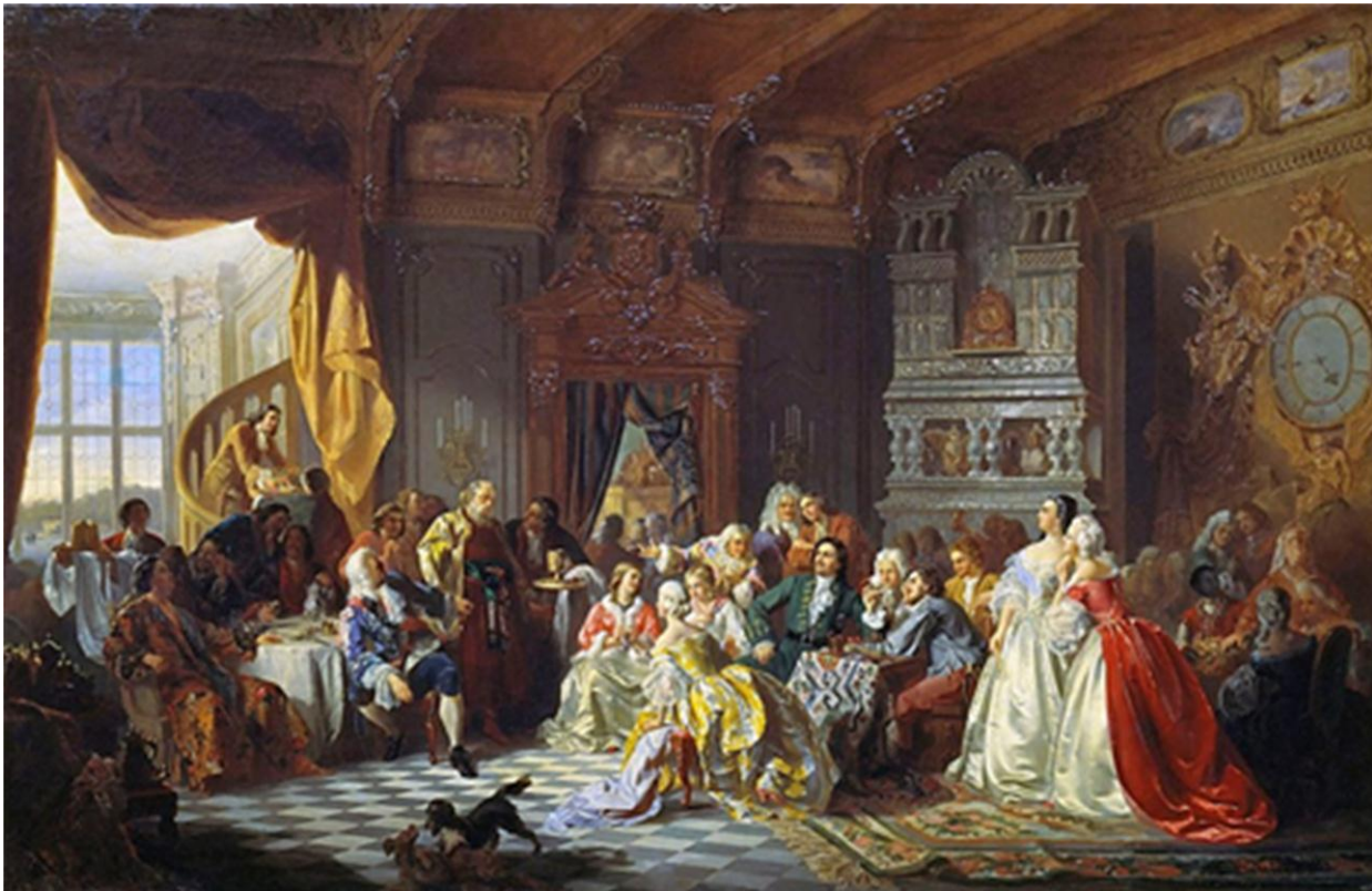
Ассамблея при Петре I (1858). Художник Хлебовский С.

Общим был только торжественный молебен – служили молебны и по остальным церквам в государстве» (1).