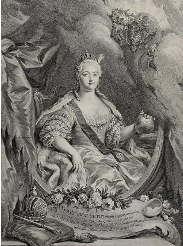
Портрет ЕЛИЗАВЕТЫ ПЕТРОВНЫ (1741–1762).

отмена смертной казни – в течение ее почти двадцатилетнего правления никого не казнили. Считается, что благодаря этому публичная смертная казнь и истязания вышли из общественных традиций и больше уже