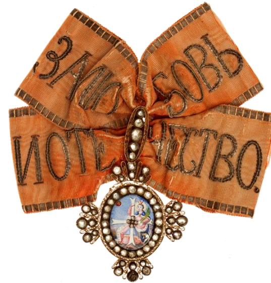
Знак ордена Святой Екатерины (малый крест) с бантом.

«обнаружив природный такт в житейских делах, Екатерина не проявила никакой способности к руководству делами государственными. Она предалась непрерывным пирам, нисколько не обременяя себя государственными заботами... Диктаторская власть над Россией Перешла в руки Меншикова» (З, 622).