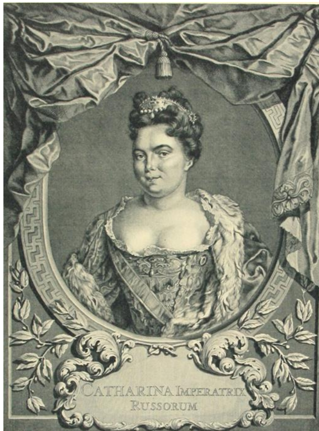
Императрица ЕКАТЕРИНА I (1724). Художник Карел де Моор. Гравюра Якоба Хоубракена.

«Петр стремился различными способами всенародно засвидетельствовать, как высоко ценил он Екатерину. В честь ее был учрежден орден св. Екатерины, ее именем был назван 60-ти пушечный корабль, для ее особы была образована Кавалергардская рота...» (3, 620).