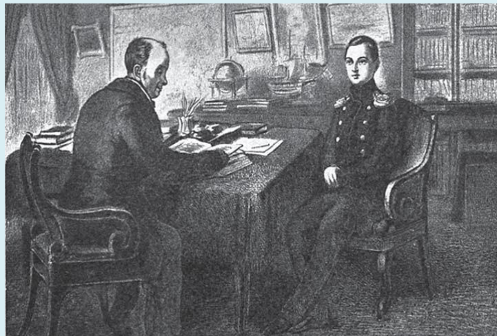
В. А. Жуковский и цесаревич Александр

В. А. Жуковский принимает участие в войне 1812 года. В 1825 году в чине надворного советника Жуковский был назначен наставником будущего императора Александра II. В этой должности он состоял до 1841 года. Василий Андреевич боролся за свое право воспитателя влиять на «душу» цесаревича, пользовался его доверием. После своей отставки он писал цесаревичу Александру: «Границы, отделяющие от Вас других, не могут и не должны быть моими границами.... Это не будет уступкою ненарушимых прав вашего сана, это будет высокое достоинство человека, а человек во всяком сане есть главное».