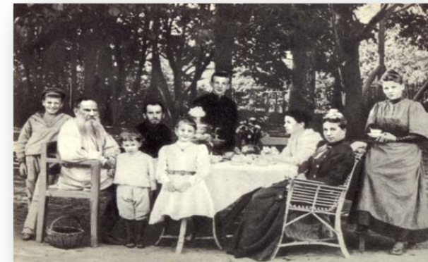
Л. Толстой в кругу семьи 1892 г.

Вскоре Толстому пришлось бросить свою педагогическую деятельность, чтобы посвящать больше времени литературе. Это дало ему возможность полностью сосредоточиться на своем главном творении – романе «Война и мир» . В конце февраля 1863 года С. А. Толстая написала из Ясной Поляны своим родным в Москву о том, что ее муж «начал новый роман». Работа Толстого над «Войной и миром» продолжалась шесть лет. Это был титанический труд, вобравший изучение огромного количества исторических источников, чтение