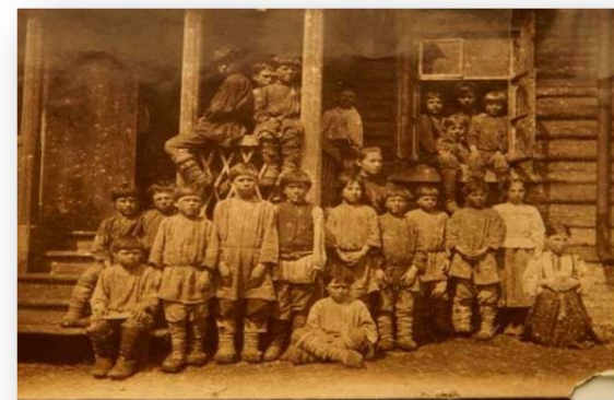
Ученики яснополянской школы

Однако, ни литература, ни школа, ни хозяйство не приносили Толстому полного удовлетворения. Самым главным условием счастья была для него семья. В 1862 г., после долгих колебаний, он сделал предложение Софье Андреевне Бернс, и оно было принято. С женитьбой Толстого начинается самый спокойный, счастливый и ровный период его жизни. Софья Андреевна оказалась идеальной женой, матерью и хозяйкой дома, Кроме того, она стала преданной помощницей мужа в его литературном труде, переписывала рукописи произведений Толстого.