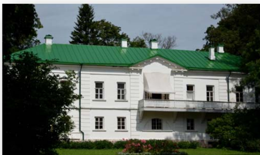
Имение Ясная Поляна