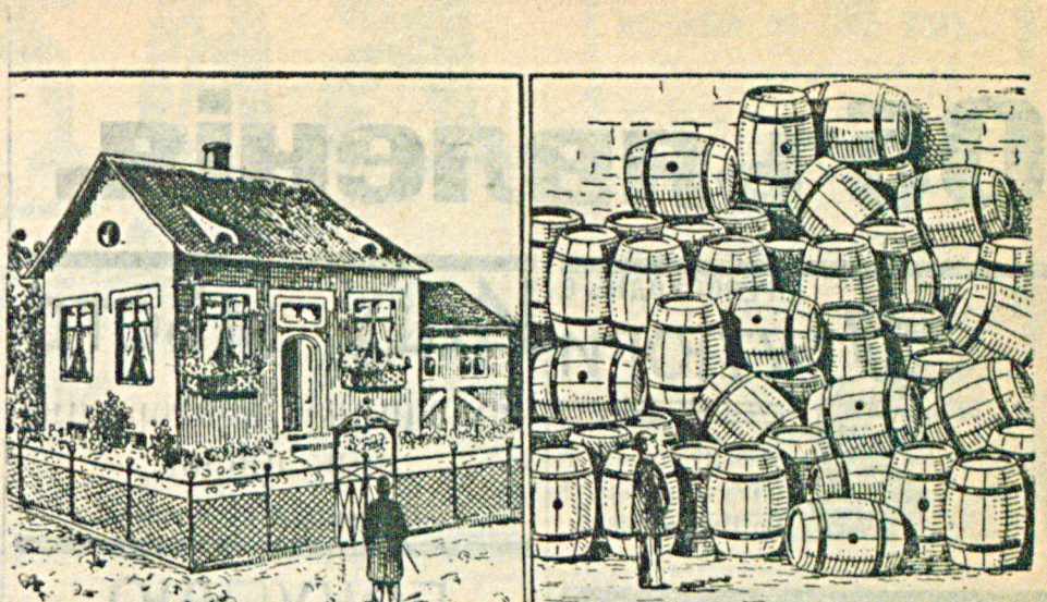
Собственность трезваго. 20 лѣтъ не пившаго никакихъ спиртныхъ нап. 20 л. водку, вино и пиво.

Гор. управа проситъ г. полиціймейстера лишить права выезда стюкажу на трое сутокъ легкопыхъ возовиковъ № 44 и 85 за нарушение таксы и грубое обращеніе съ пассажирами.