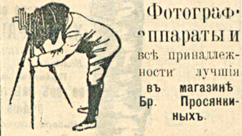
Фотограф. аппараты и принадлежности въ магазинѣ Бр. Проявляющихъ.

Кромѣ того рѣшено ввести занятія въ смѣшан. училищахъ въ томъ числѣ и для мальчиковъ и открыть съ осени 1912 г. женск. профессиональное училище для препода. рукодѣлія по болѣе обширной программѣ.