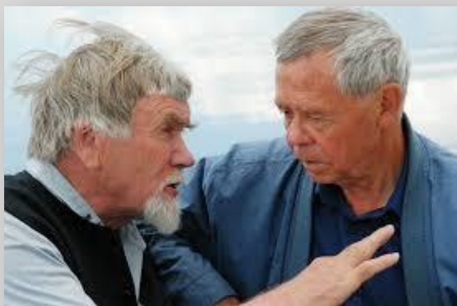
В. Я Курбатов и В. Г. Распутин. На Ангаре, 2009 год.

Курбатов В. Долги наши. Валентин Распутин – чтение сквозь годы / Валентин Курбатов // Дружба народов. – 2007. – № 2. – С. 186-200.