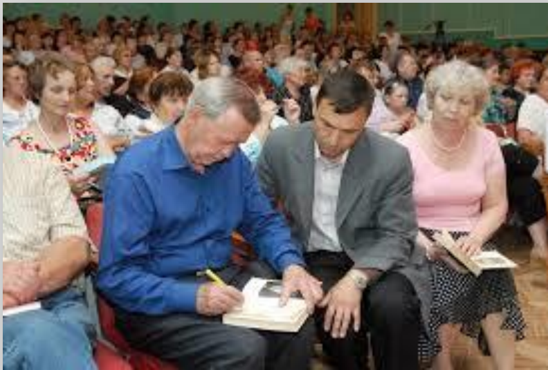
В. Г. Распутин на встрече с читателями.

В нынешнем, 2017 году, В. Г. Распутину исполнилось бы 80 лет. Вклад, который он внес в литературу России, трудно переоценить. Статьи о жизни и творчестве Валентина Распутина, конечно, еще появятся в российской прессе, но это уже будет после его юбилея.