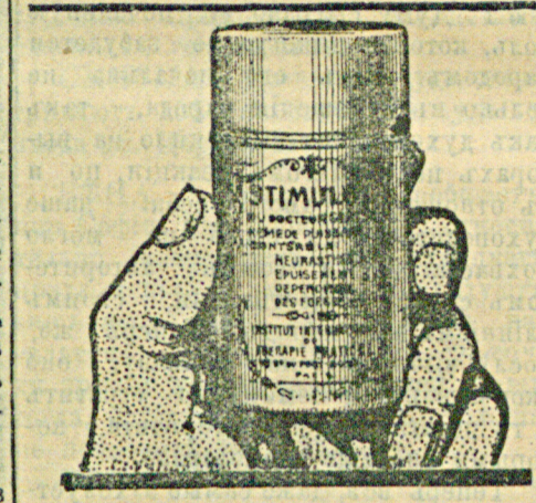
Стимулоль Д-ра Глаза новейшее средство для лечения полового невралгическаго (бесилія).

Когда мнѣ стало немного легче, я сказалъ своей женѣ, что, если къ концу недѣли мои боли не повторятся, и я напишу въ газету для того, чтобы всѣ знали объ этомъ даровомъ средствѣ. Теперь у меня нѣтъ сомнѣній, что я излеченъ. Излеченъ послѣ того, какъ въ теченіе 10 лѣтъ ни ночью, ни днемъ не имѣлъ покоя отъ своихъ ужасныхъ страданій. Я увѣренъ, что этотъ рецептъ излечитъ всякія боли, будь то невралгія, ишиасъ, ревматизмъ, боль поясницы, головныя боли и т. д.