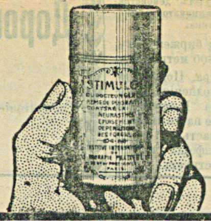
Стимулол Д-ра Глаза