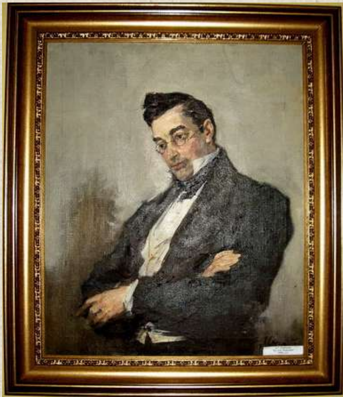
Акварельный портрет работы Петра Андреевича Каратыгина (1805—1879).

В это время после подписания Гюлистанского мирного договора налаживались непростые отношения России с Персией.