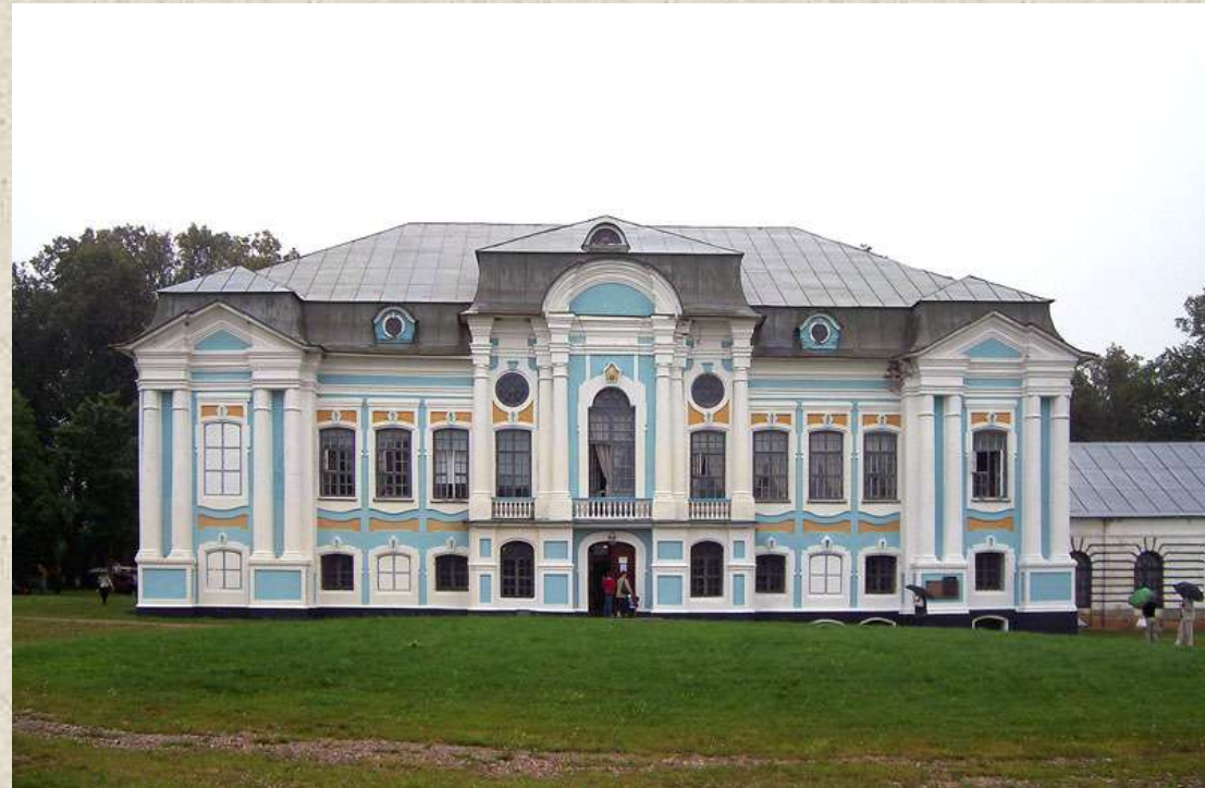
Государственный историко-культурный и природный музей-заповедник «Усадьба А. С. Грибоедова «Хмелита». Вяземский район Смоленской области.