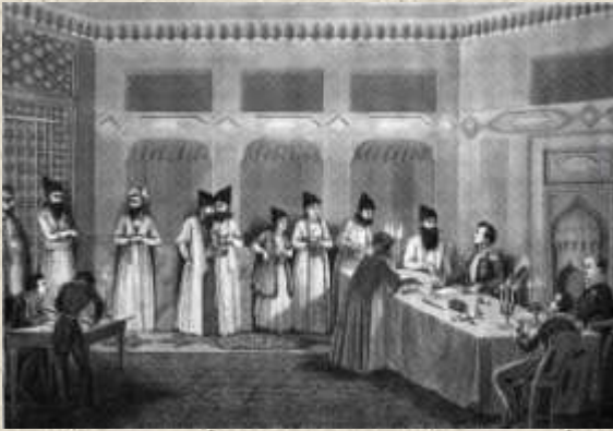
10 февраля 1828 г. С картины В.Машкова. Грибоедов сидит за столом первый справа, спиной к зрителю.