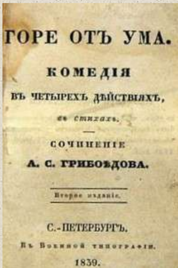
Издание 1839 г.

В мае 1824, получив от Ермолова разрешение о продлении отпуска, Грибоедов приезжает в Петербург, где с большим успехом читает свою комедию. Но цензура запрещает печатание и постановку пьесы. Лишь удачливому журналисту Ф. В. Булгарину удается напечатать фрагменты комедии в литературном альманахе.