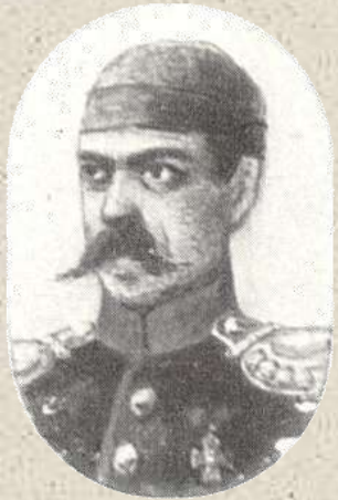
А. И. Якубович. Портрет неизвестного художника.

Встретившись с Грибоедовым, Якубович напомнил ему об отложенной дуэли, которую необходимо было завершить. Памятью об этой дуэли Грибоедову остается простреленная кисть левой руки.