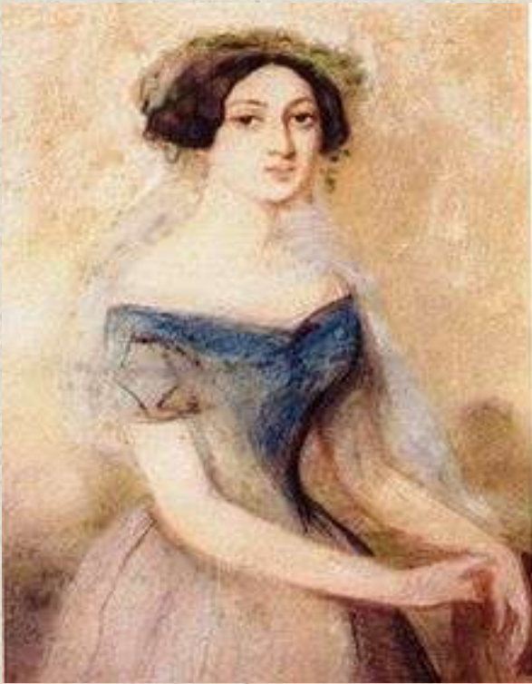
Нина Александровна Грибоедова. С портрета Э. – Ф. Дессен.

Вновь навестив Прасковью Ахвердову, он увидел повзрослевшую Нину Чавчавадзе, стройную, черноглазую красавицу-княжну. Она оставалась такой же приветливой и веселой, без кокетства и жеманства, разговорчивой и умной, без напыщенности и самовлюбленности. Пользовавшийся успехом у женщин Грибоедов никогда не испытывал глубокой и сильной привязанности. Впервые трепетные чувства овладели им. Но он полностью занят службой. Назначенный на должность главноуправляющего Кавказом И. Ф. Паскевич дает Грибоедову распоряжение по поводу последних сношений с Тавризом и Тегераном.