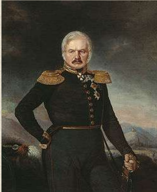
Портрет генерала Алексея Петровича Ермолова. Художник П. Захаров.

Российское консульство в Персии размещалось в городе Тавризе. Представителей русской миссии принял даже иранский шах Фетх-Али. Относительная обустроенность жизни Грибоедова в Тавризе: собственный дом, слуга, общение с местными чиновниками и английскими дипломатами не смогли приглушить ностальгических чувств к близким и друзьям, оставленным на родине. Именно здесь, в Тавризе, в 1820 году Грибоедову приснился пророческий сон, что он должен написать пьесу о нравах Московского общества. Но от этого замысла до воплощения пройдет ещё долгих четыре года, когда комедия «Горе от ума» будет закончена.