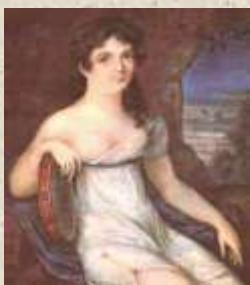
Портрет Авдотьи Истоминой. Неизвестный художник.