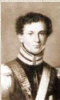
Граф Василий Васильевич Шереметев. 1810-е годы. Неизвестный художник.