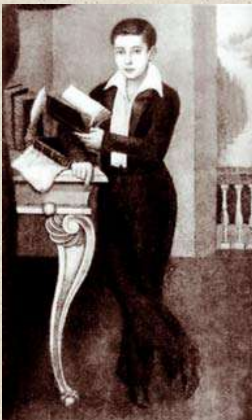
А. С. Грибоедов в отрочестве. Работа неизвестного художника.

У родившегося в 1795 году Грибоедова было детство ребенка из хорошей дворянской семьи, хотя отец почти не участвовал в воспитании сына. Жесткая и властная мать дала ребенку прекрасное образование. Его домашними учителями были университетские профессора, музыкальные уроки давал известный композитор и пианист Джон Филд. Он возлагал на Александра, увлекающегося сочинительством музыки и импровизацией, большие надежды.