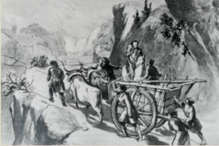
Встреча А.С. Пушкина с телом А.С. Грибоедова. С акварели П.Борея.