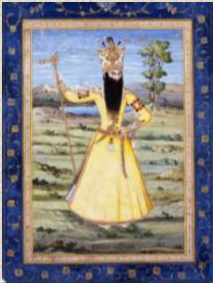
Шах Персии Фетх Али-шах.

Оставалось несколько дней до отъезда в Тавриз. Нина выезжает в Персию вместе с мужем. Огромный караван из 110 лошадей и мулов въезжает в Армению, где в Эривани, столице Армении, князь Чавчавадзе впервые увидел своего зятя. Нина собиралась ехать в Тегеран, но, почувствовав себя плохо, вынуждена была прервать поездку. Это спасло ей жизнь.