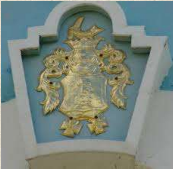
Фамильный герб Грибоедовых.

Судьба сложилась так, что родители Александра носили одну и ту же фамилию: своей женитьбой они объединили две ветви одного старинного дворянского рода.