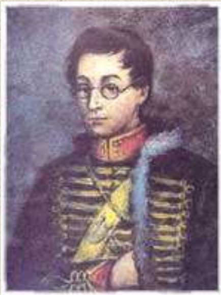
А.С.Грибоедов – гусар. Неизвестный художник.