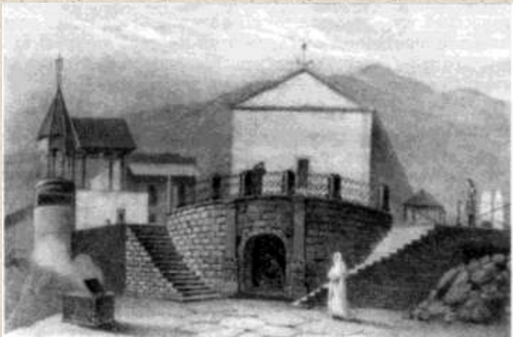
Могила А. С. Грибоедова в Тбилиси. С литографии Борея.

Прах Грибоедова по воле жены доставили в Тифлис. По пути с этой печальной процессией встретился путешествуя по Кавказу другой поэт А. С. Пушкин. «Два вола, впряженных в арбу, подымались по крутой дороге. Несколько грузин сопровождали арбу. «Откуда вы?» - спросил я их. - «Из Тегерана». - «Что вы везете?» - «Грибоеда». Это было тело убитого Грибоедова, которое препровождали в Тифлис» - так писал Пушкин в очерковой книге «Путешествие в Арзрум».