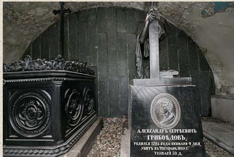
Надгробье А.С. Грибоедова в Тифлисе (Тбилиси) в монастыре Давида, на склоне горы Мтацминда. Скульптор памятника на могиле В. И. Демут- Малиновский.

Безутешная вдова Нина Чавчавадзе прожила еще тридцать лет, так и не выйдя замуж, а на могиле Грибоедова в Тифлисе начертана составленная ею надпись: «Ум и дела твои бессмертны в памяти русской, но для чего пережила тебя любовь моя!». Эпитафия жены – самый точный и трогательный памятник А. С. Грибоедову. И, конечно, памятником поэту осталась комедия «Горе от ума».