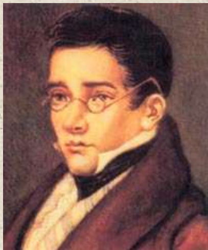
Портрет А. С. Грибоедова. С гравюры И. С. Уткина. 1829 год.