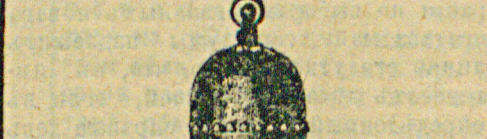
Магазинъ „Т-во Энергія“