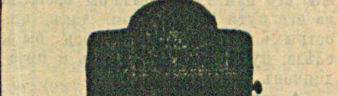
Магазинъ „Т-во Энергія“