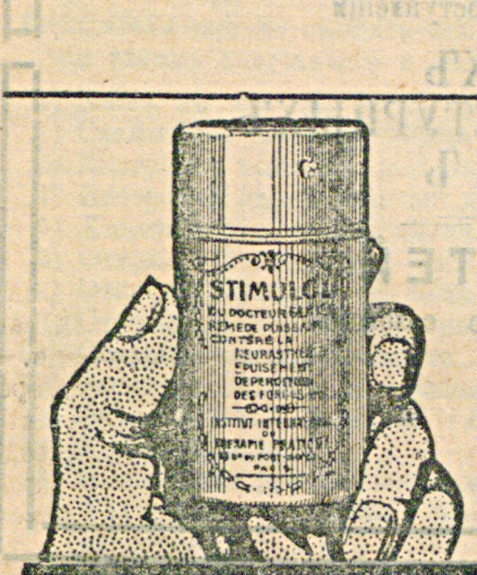
Стимулолъ Д-ра Глаза.

Для распространенія въ Россіи, заграничнѣя фабрика шелку поручила намъ продавать ихъ надѣянъ въ теченіи одного мѣсяца. Только за 65 коп. съ пересылкой. Довольное количество материала для шитья самой большой дамской шелковой блузы въ разныхъ цѣтахъ. При заказѣ указать желаемыя цѣты. Выслается только по полученіи стоимости (можно почтовыми марками) Адресуйте: И. Мильграму, Варшава, Королевская 29—8.