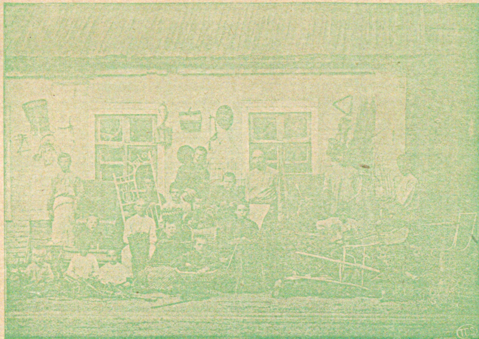
Корзиночная мастерская св.-Оссіевскаго братства въ г. Майкопѣ.