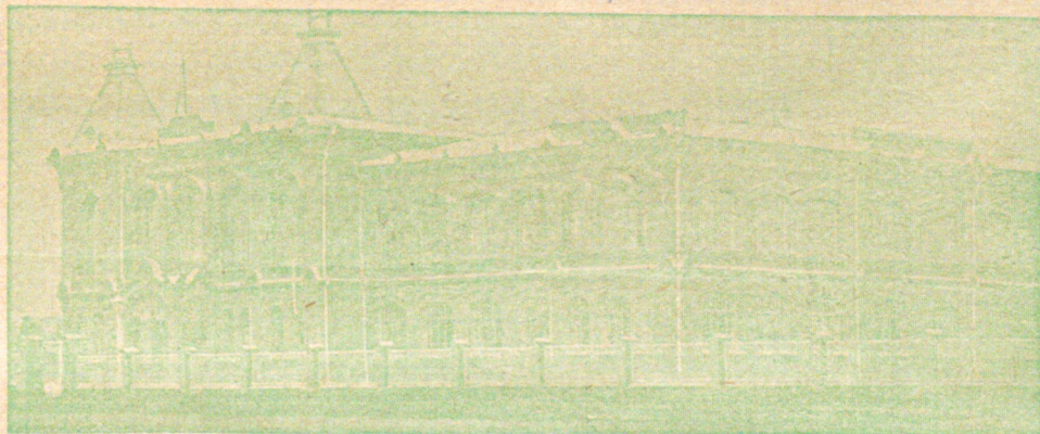
Реальное училище въ г. Майкопѣ.