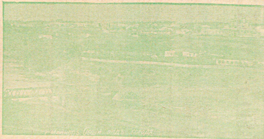
Видъ на городъ Майкопъ.