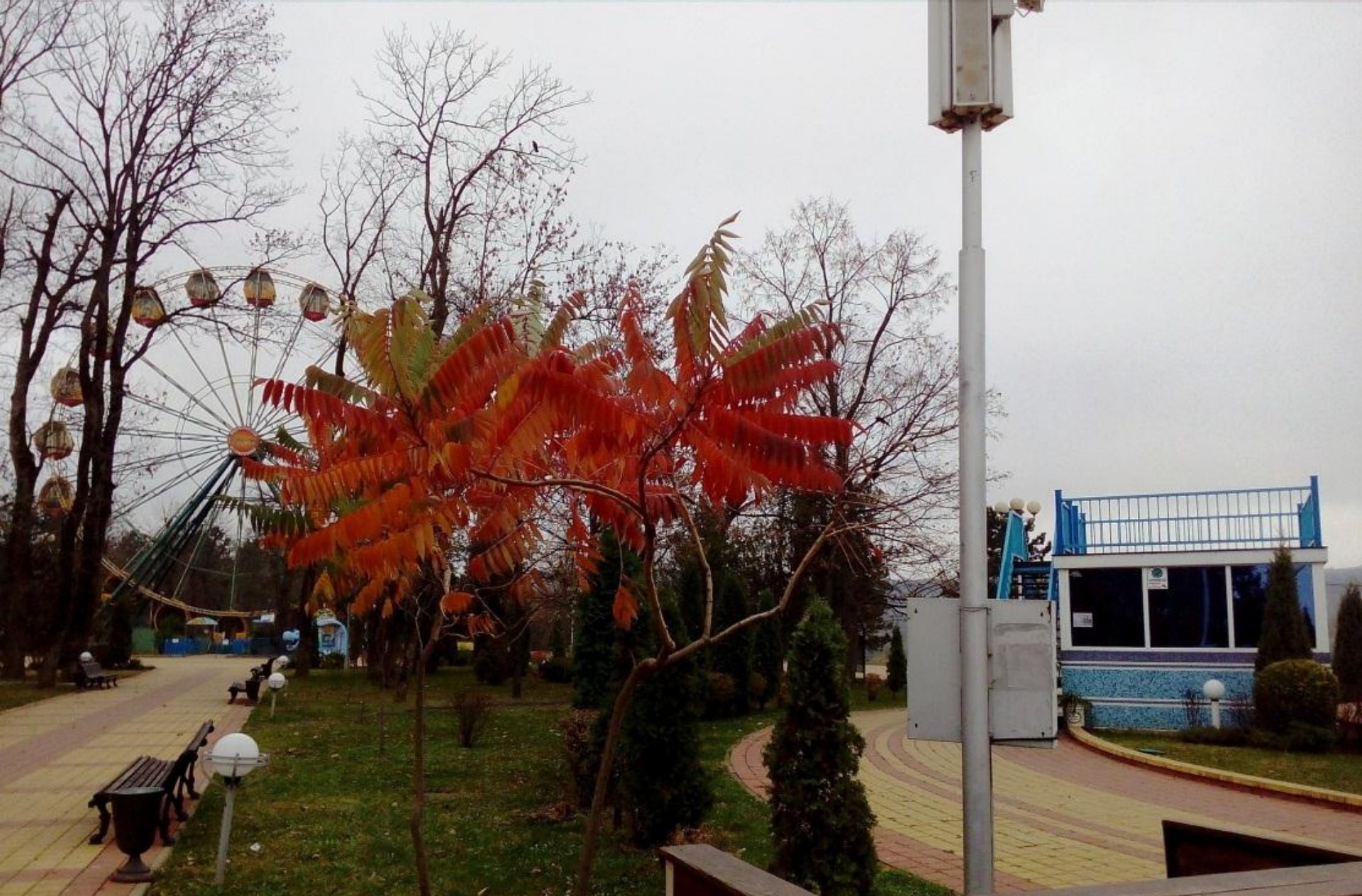
Осенний костер. Место съемки: Городской парк г. Майкопа