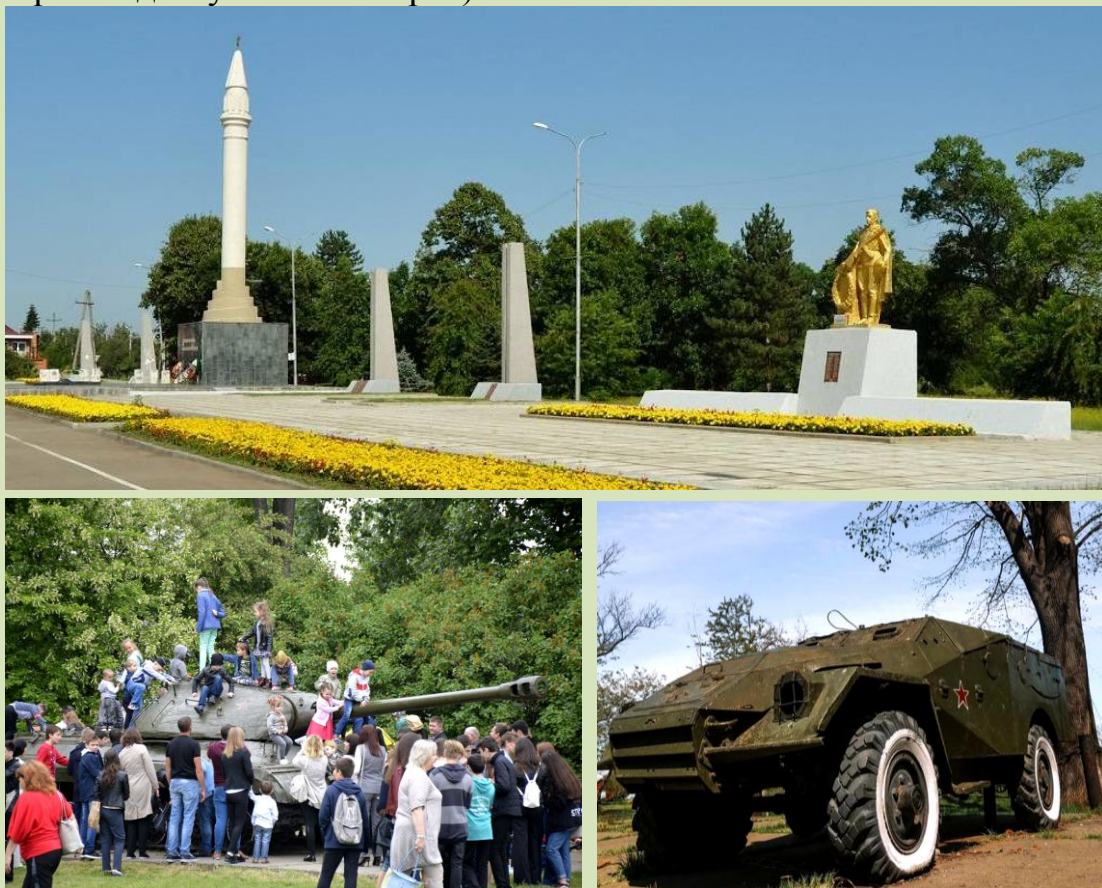
Рис.2. Мемориал города Майкопа и парк с выставкой военной техники

К сожалению, не смотря на достаточно большую территорию, мемориальный комплекс и парк не вошли в программу благоустройства и сегодня его потенциал использован слабо (во многом это обусловлено слабой транспортной доступностью парка).