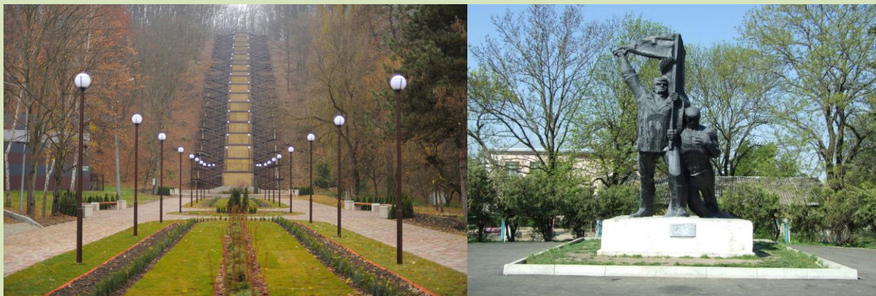
Рис.8. Лестница «Мэздах» на хребте Нагиеж-Уашх. Памятник «Жертвам белого террора»

Памятник «Жертвам белого террора» на братской могиле воинов, погибших в годы Гражданской войны, был установлен в Майкопе в 1928 году. В 1942 году он был уничтожен и вновь открыт в 1951 году. В ночь с 20 на 21 сентября 1918 года в Майкопе по приказу белогвардейского генерала Покровского были расстреляны и зарублены в районе памятника по улице Ушинского полторы тысячи человек, а на Привокзальной площади еще две тысячи человек. Эта расправа без суда и следствия была одним из многих примеров «белого террора» из-за своей жестокости, получившая название Майкопской резни.