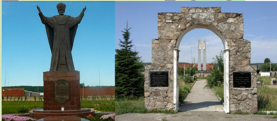
Рис.10. Скверы и парковые зоны микрорайона «Восход»