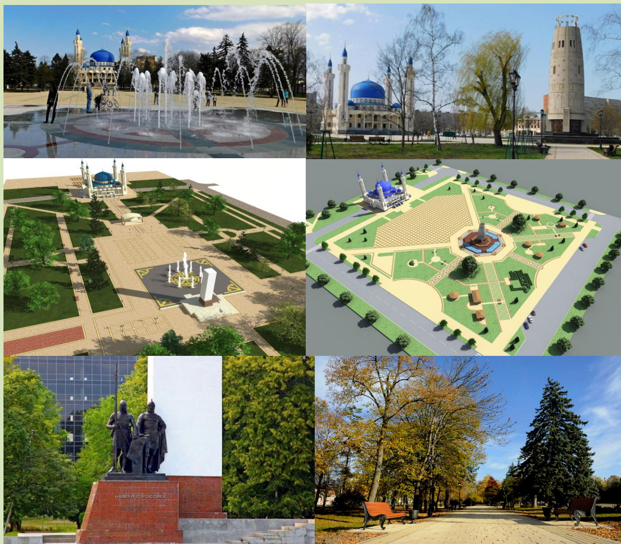
Рис. 5. Архитектурный комплекс – площадь Дружбы, Соборная мечеть, площадь Памяти и единения

Продолжением рекреационной зоны у Соборной мечети стала новая парковая зона вокруг открытого в 2013 году Монумента Памяти и Единения - памятника «Очаг», посвящённого памяти жертв Кавказской войны. Оборудована площадка для проведения массовых мероприятий, вымощены брусчаткой дорожки, смонтировано освещение. Таким образом, в городе появилась еще одна большая – с учетом рядом расположенной площади Дружбы – зеленая зона и примечательный архитектурный ансамбль – республиканская филармония, Национальный музей, Соборная мечеть.