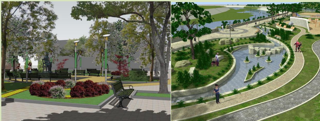
Рис. 7. Проекты благоустройства сквера по ул. Краснооктябрьской и набережной р. Белая

скалодром и скейтотрому. В зеленой зоне установят скамейки и прочие малые архитектурные формы. Также планируется обустроить лестничные сходы к реке. В близ городского парка благоустроят сквер по улице Краснооктябрьской, что позволит создать цельную и масштабную зону рекреации.