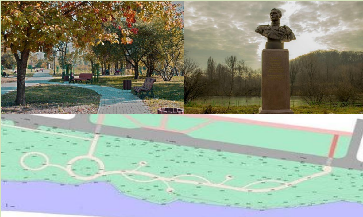
Рис.9. Сквер Авиаторов

9. Сквер Авиаторов. Берег реки Белой в районе Шовгеновского городка всегда был излюбленным местом отдыха майкопчан. Зеленая зона по улице Лесной была благоустроена в 2017 году в рамках реализации федерального проекта «Формирование комфортной городской среды». Здесь оборудованы прогулочные дорожки, площадки для отдыха, установлены скамейки, урны, светильники, парковые качели, уличные фонари. Новый сквер идеально вписался в привычный ландшафт, не было вырублено ни одного дерева, а посажены около 60 новых саженцев клёнов. А аллее сквера установлен мемориал Александру Покрышкину – Герою Советского Союза, известному летчику-истребителю Великой Отечественной войны. Мону­мент был передан городу командованием учебной авиационной базы – правопреемницы 761-го авиаполка. По предложению представителей ветеранской общественности, в сквере по улице Лесной планируется установить памятник трижды Герою Советского Союза, маршалу авиации Александру Покрышкину.