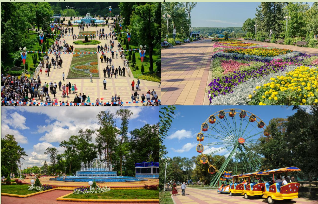
Рис. 6. Городской парк культуры и отдыха г. Майкопа

Территория горпарка разделена на несколько зон. Одна из них – зона активного отдыха. Здесь размещаются аттракционы и кафетерии. Ежегодно, аттракционы парка посещают порядка 550 тыс. человек. Территория вокруг бассейна и склон парка – это пляжная зона Майкопа. По берегам бассейна посажены каштаны, платаны и сосны, в тени которых уютно располагаются отдыхающие. Длина бассейна – 500 метров.