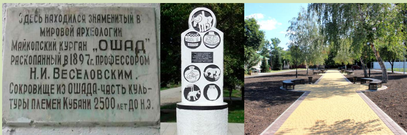
Рис.4. Сквер на месте Майкопского кургана «Ошад»

В 1972 году на месте, где стоял одиннадцатиметровый Майкопский курган Ошад, воздвигнут памятник в виде фигурной каменной плиты скульптора Шикояна. В 2019 году был благоустроен сквер и обустроены детские площадки у памятника.