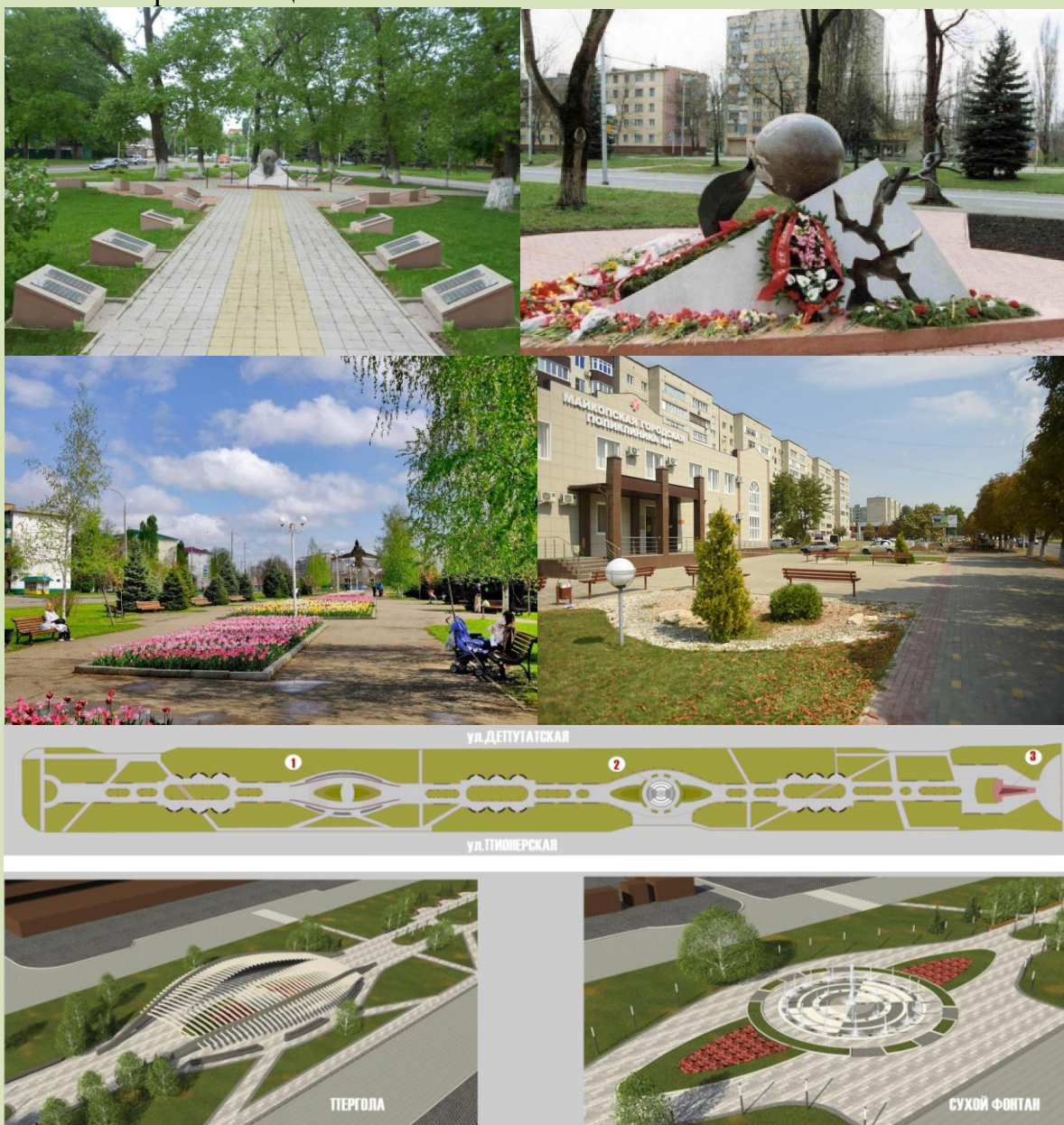
Рис.11. Памятник жертвам Чернобыльской катастрофы, бульвар Победы, Сквер напротив нового корпуса Майкопской городской поликлиники №1, проект благоустройства бульвара Победы

11. Скверы микрорайона «Черемушки». Микрорайон «Черемушки» является самым густонаселенным районом города, однако, под рекреационные зоны отведены совсем небольшие территории. В связи с этим благоустройство многочисленных скверов по улице Пролетарской значительно повышает качество жизни и отдыха майкопчан и гостей города. Для туристов будет интересно посетить сквер у памятника жертвам Чернобыльской катастрофы, открытый 28 апреля 2003. Памятник представляет собой конструкцию, символизирующую техногенную катастрофу, от которой тянется к земному шару зеленый лист, олицетворяющий неиссякаемость жизни. Тrolleybusная остановка на ул. Димитрова была переименована – теперь она называется «Памяти черныбыльцев».